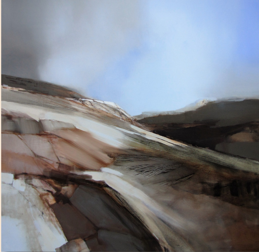
November på vidda olje på lerret