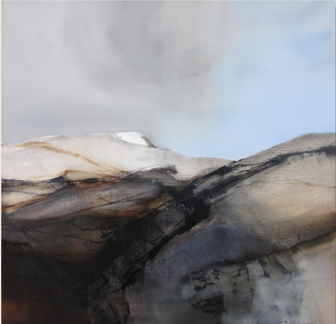
En god dag på fjellet