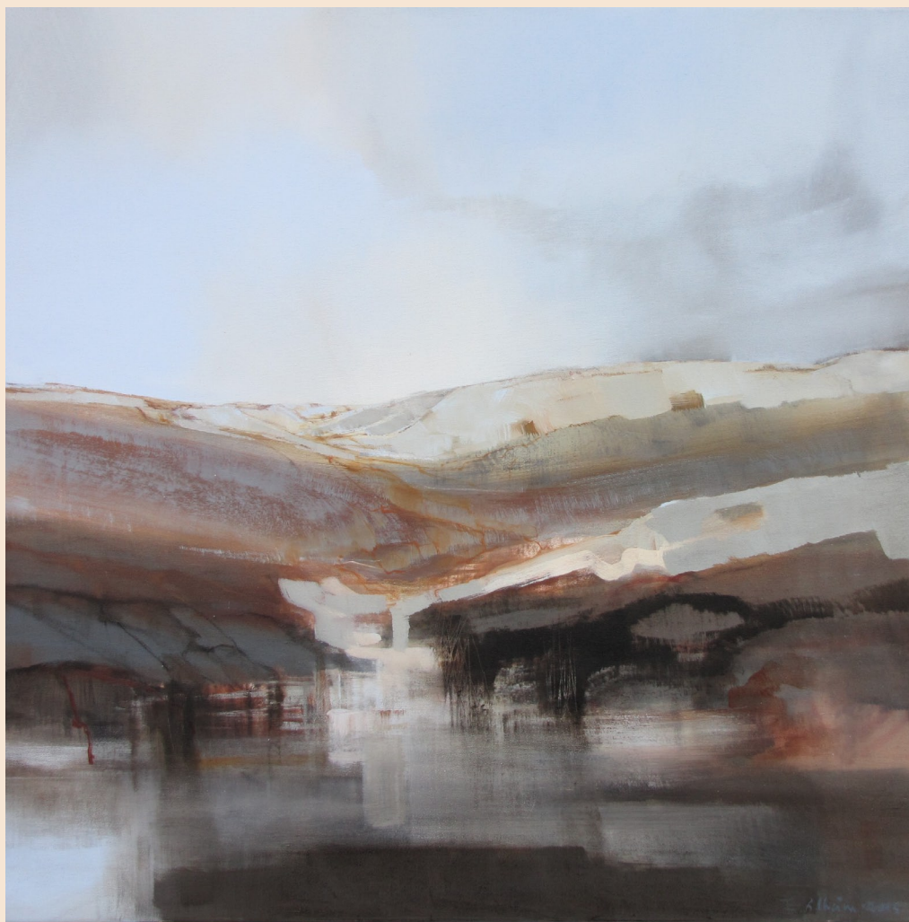
Senhøst på vidda