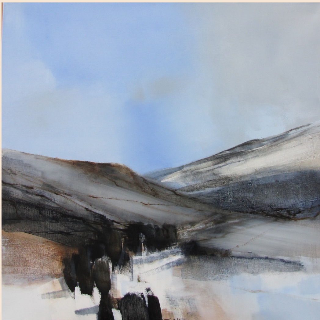
Stien over fjellet