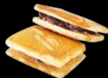
蔓越莓三明治 蔓越莓乾果、奶油