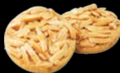
富貴酥 蜂蜜、杏仁條