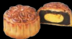
黑糖月餅 豆沙蛋黃、蓮蓉、棗泥 蓮蓉蛋黃、棗泥蛋黃 鳳梨、棗泥核桃、栗子