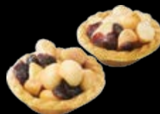
堅果塔 火山果、蔓越莓