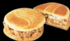
蜜蕾核桃 蜂蜜、核桃