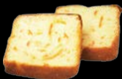
香橙芙露滋 桔子片、桔子醬