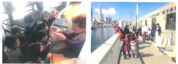
春のフェイールドトリップの様子

先日、子どもたちに「風はどこから来るのだろう、風に色やにおいはあるかな？」と尋ねてみたところ、思い思いの答えが返ってきました。一部をご紹介します。