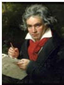
著名神童贝多芬公开表演时才七岁。