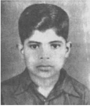
杜宁帝拉卡纳那 逝于1954年11月9日