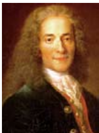
伏尔泰, 法国著名的神童哲学家, 主张改革当时武断和封闭的欧洲社会。他三岁时就能阅读枫丹寓言。

假设这些神童和天才于前生获得他们的技能, 那不是很合理的解释吗? 我们可以解释他们的才能是前世密集修行的成果。目前似乎没有其他充分的理由对如此不寻常的技能作出解释。