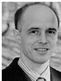
詹德可博士，目前是美国弗吉尼亚大学的精神病医学的助理教授，曾研究过许多轮回个案。