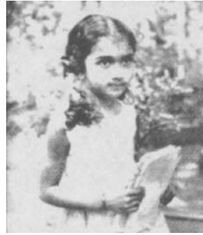
惹那帝拉卡 再生于1956年2月14日

当惹那帝拉卡见到前世的弟弟时，她拒绝多看他一眼或与他谈话。后来，她前世的父母解释这两兄弟时常互相打斗和争吵。可能惹那帝拉卡今生心中还怀着前世结下的怨恨。