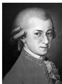
音乐神童莫扎特六岁之前 就能编曲。