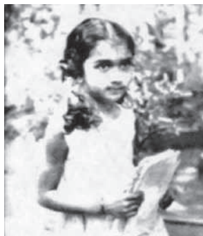
惹那帝拉卡 再生于1956年2月14日

当惹那帝拉卡见到前世的弟弟时，她拒绝多看他一眼或与他谈话。后来，她前世的父母解释这两兄弟时常互相打斗和争吵。可能惹那帝拉卡今生心中还怀着前世结下的怨恨。