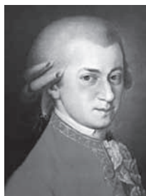
音乐神童莫扎特六岁之前 就能编曲。