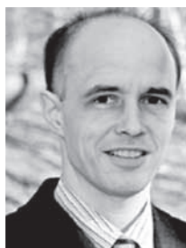
詹德可博士，目前是美国弗吉尼亚大学的精神病医学的助理教授，曾研究过许多轮回个案。