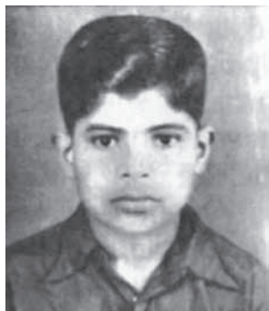
杜宁帝拉卡纳那 逝于1954年11月9日