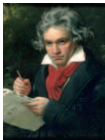
著名神童贝多芬公开表演时才七岁。