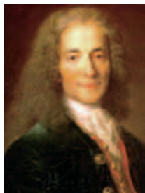
伏尔泰, 法国著名的神童哲学家, 主张改革当时武断和封闭的欧洲社会。他三岁时就能阅读枫丹寓言。

假设这些神童和天才于前生获得他们的技能, 那不是很合理的解释吗? 我们可以解释他们的才能是前世密集修行的成果。目前似乎没有其他充分的理由对如此不寻常的技能作出解释。