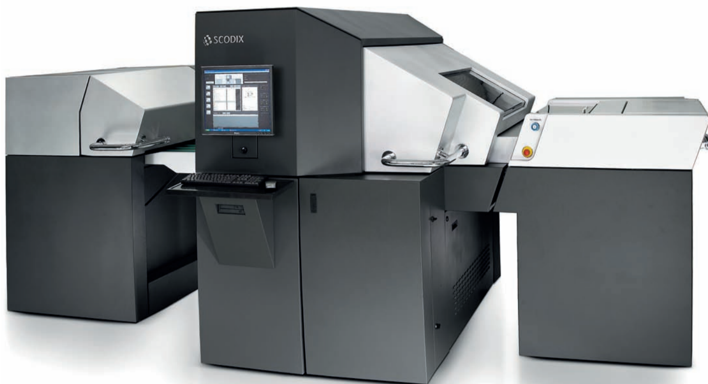
Digitální lakovací stroj SCODIX.

ným kritériem pro jejich finální podobu cena tohoto obalu, a na druhé straně existují obaly exkluzivní. Levný obal má čisté ochrannou funkci a při jeho tvorbě se hledí především na minimální vliv jeho ceny proti ceně samotného výrobku. Obal zde nemá žádnou marketingovou ani reklamní hodnotu a v tomto případě není tím, co zákazníka motivuje nebo přesvědčí ke koupi. Druhou kategorií jsou naopak obaly, které mají jednoznačně vzbudit zájem zákazníka a vyvolat dojem luxusu, výjimečnosti a touhy zboží vlastnit.