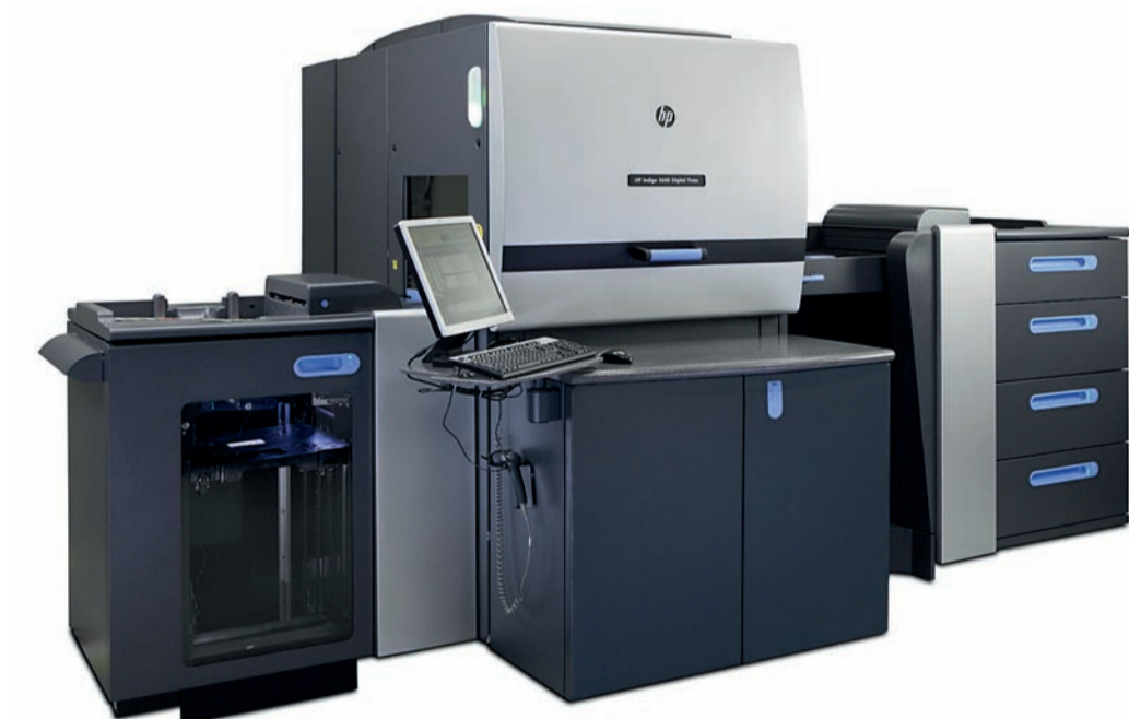
HP Indigo 5600.

Na tento trend samozřejmě reagují i výrobci zařízení pro výrobu a zušlechtní obalů. A právě takovým výrobcem je izraelská firma Scodix. Digitální tisk prodělává v posledních letech ohromný rozmach, ale digitální dokončovací stroje stále trochu ve svých možnostech pokulhávají. Jedněmi z mála skutečně digitálních dokončovacích technologií byly donedávna laserové vý-