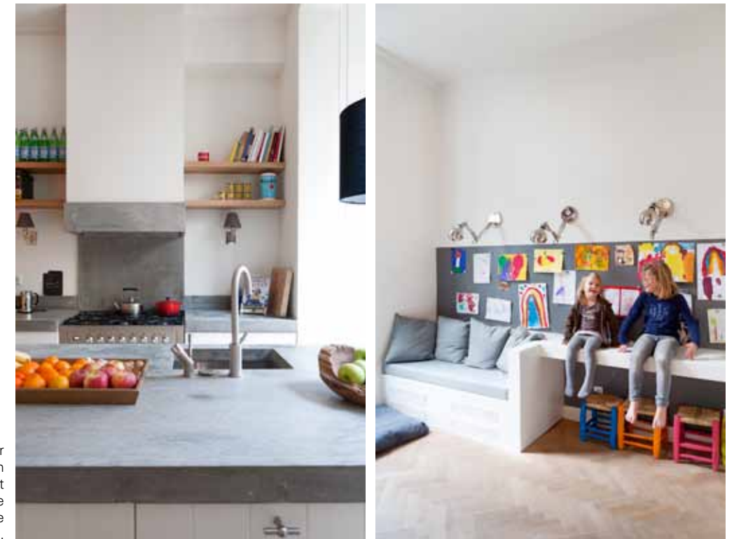
Foto links: de keuken werd uitgevoerd door Rob Kossen. De landelijke plachetdeuren krijgen een hedendaagse uitstraling door het massieve werkblad. Foto rechts: hoewel de inrichting sober werd gehouden, zorgen de kinderen ervoor dat het huis kleur krijgt.

oorspronkelijke stijl van het huis. Daarnaast kwamen nog drie aparte kinderkamers, een familiebadkamer en een aparte wc. Door de efficiënte indeling lijkt de verdieping zelfs groter dan voorheen.