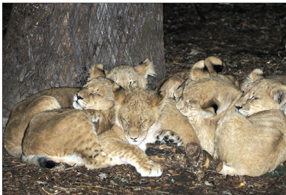
Mørket faldt på - og i Zoologisk Have faldt dyrene til ro, selv om der var rigtig mange nysgerrige besøgende med lommelygter og kamera med blitzlys.