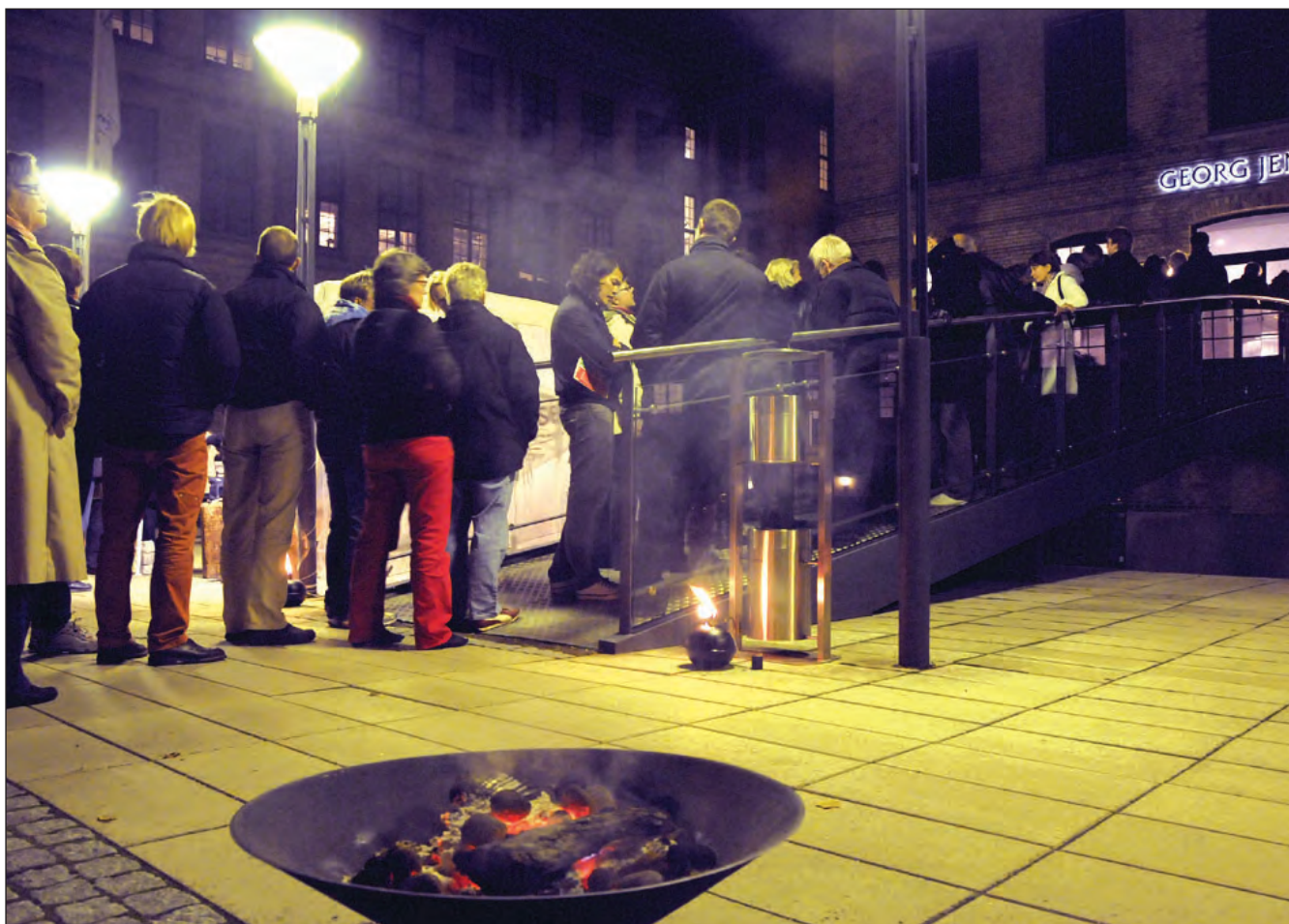
Aftenens overraskelse fik Georg Jensen i besøgstal. Sølvmedjen var for første gang åben for offentligheden, hvilket skabte en lang kø foran bygningen.

som var en del af den kulturpas pakke, der bl.a. gav adgang til offentlig transport hele aftenen. Mange steder inviterede man indenfor i varmen.