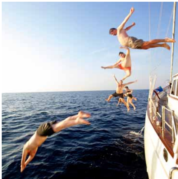
航海旅行最忌的就是船上生活沉闷,单是游泳一件事,就被玩出了很多花样

船主也不会把船租给你的。目前在中国类似的生意很少,而在泰国有很多。你必须知道你想干嘛,是想租一条小船还是想租条大船。你必须很懂船。在船上的人就算是一个团队了,你们必须互相信任。某种意义上来说,牵头的那个人就是船长了。比如这次我们12个人去泰国和缅甸,因为租的是一条26米长的大船,船上很多硬件和工具我们没有用过,这样请一位老师随行就是必要的。我们租船的时候就跟船主提出,船由我们自己开,但要租一位老师随行。一旦出现错误或者问题就可以及时请教老师。船主本人就是老师,他跟我们完成了两个星期的海上之旅。