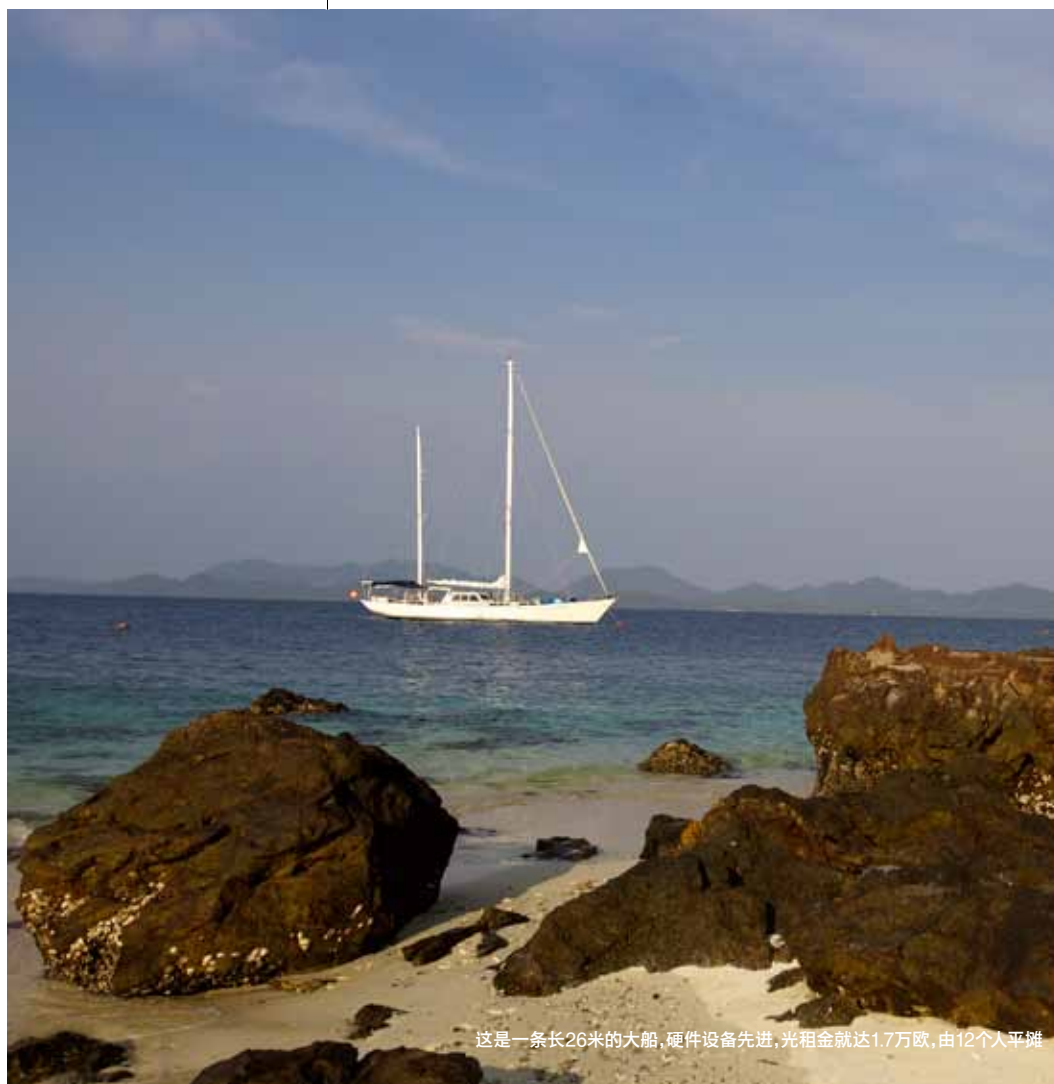
这是一条长26米的大船，硬件设备先进，光租金就达1.7万欧，由12个人平摊

A： 从原理上来说，每个人都可以租一条船。但是如果你什么都不懂的话可是非常危险的一件事，