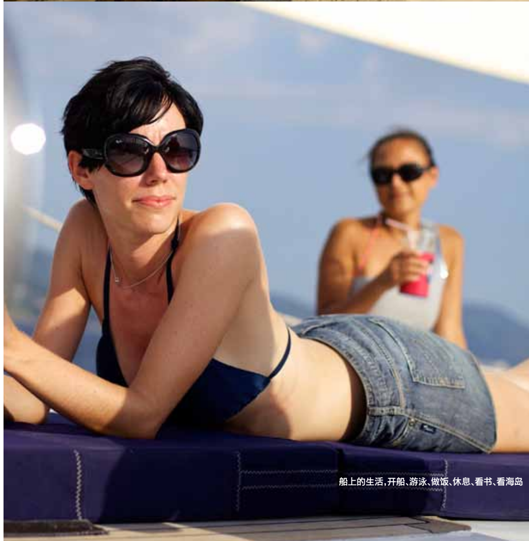
船上的生活，开船、游泳、做饭、休息、看书、看海岛