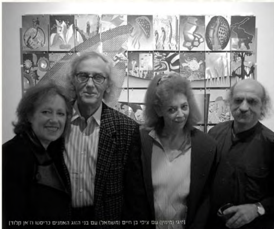
זיגי (מימין) עם ציפי בן חיים (משמאל) עם בני הזוג האמנים כריסטו וז'אן קלוד

"אצלי הכל מונו: כלב אחד, ילד אחד, אישה אחת ואלוהים אחד"