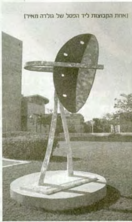
[אחת הקבוצות ליד הפסל של גולדה מאיר]

אחד האמנים הישראלים המצליחים ביותר בניו-יורק. הוא חי ויוצר בסוהו עוד מהזמן שאפילו האמנים לא הגיעו לרובע, פסל חוצות שלו ניצב בעבר בסמוך לאו"ם, והגוגנהיים רכש כבר שלוש עבודות שלו. בשבוע שעבר נפתחה תערוכה חדשה של עבודותיו בגלריה סטקס בצ'לסי