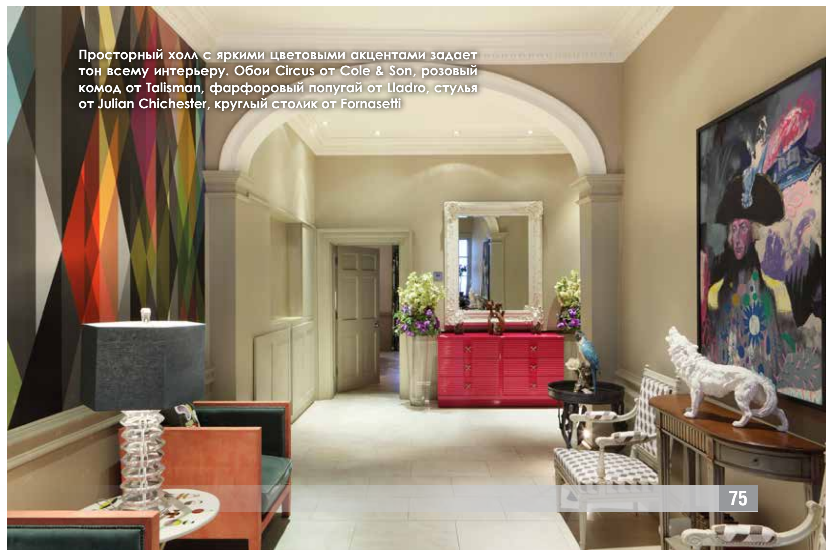
Просторный холл с яркими цветовыми акцентами задает тон всему интерьеру. Обои Circus от Cole & Son, розовый комод от Talisman, фарфоровый попугай от Lladro, стулья от Julian Chichester, круглый столик от Fornasetti