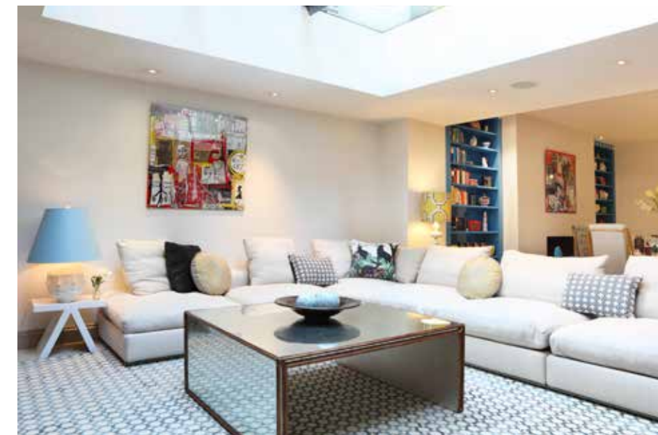
Гостиная первого этажа – пример колористического баланса. Стекланный кофейный стол от Julian Chichester, ковер от The Rug Company, картина художницы Сильвии Кальмджейн, диван Groundpiece от Flexform, настольная лампа от Джонатана Адлера