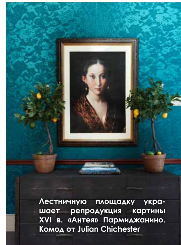
Лестничную площадку украшает репродукция картины XVI в. «Антея» Пармиджанино. Комод от Julian Chichester

На цокольном этаже находится комната, где реплики прошлого переключаются с дизайном XX в.: под репродукцией Вермеера Ребекка поместила итальянское кресло 1950-х – один из своих любимых предметов в доме