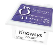
Flashcards Box Sets