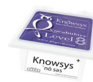
Flashcards Sets en cajas