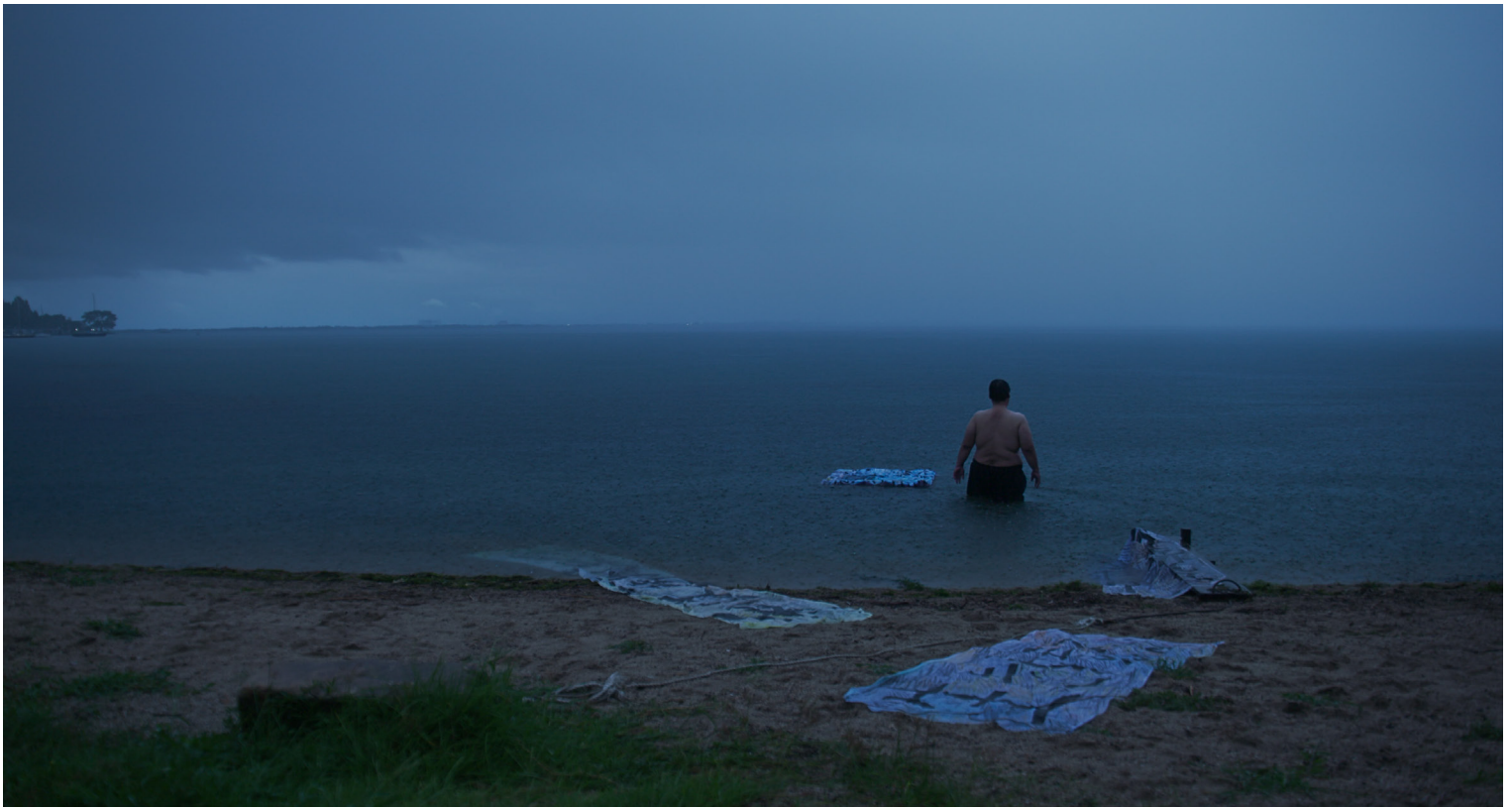
Portrait-action de Mastuda, réalisation : Victor Zebo