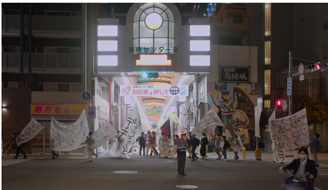
La “hikikomori démo”, réalisation : Victor Zebo

La “ hikikomori démo ” : Véritable happening filmé, la “hikikomori démo” est une action collective surprenante dont l’énergie sous-tend l’ensemble de la pièce, revenant sous forme de chapitres filmés autonomes ou se juxtaposant aux actions scéniques. Cette manifestation se déroule dans l’espace public ; munis de banderoles géantes et de hauts-parleurs, une trentaine de hikikomori descendent dans la rue à l’heure de pointe. Installation de banderoles, sit-in, prises de parole, cuisine sur place d’un repas ensuite partagé avec les passants, défilé dans les rues... faisant un pied de nez à l’invisibilisation de ce phénomène tabou, ils revendiquent leur marginalité, ensemble.