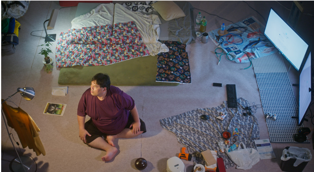
Mastuda, l'un des interprètes hikikomori