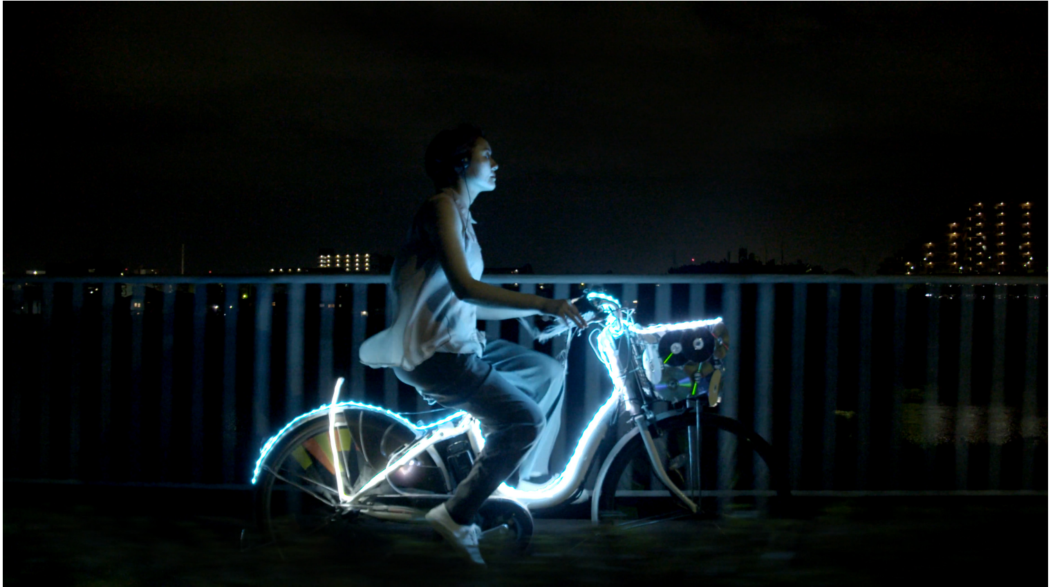
Portrait-action de Shizuka, réalisation : Victor Zebo