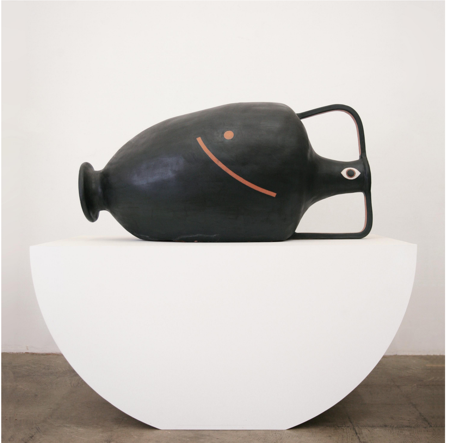
Reclining 2 Nude , 2016 Courtesy Cammie Staros et Galerie Lefebvre & Fils