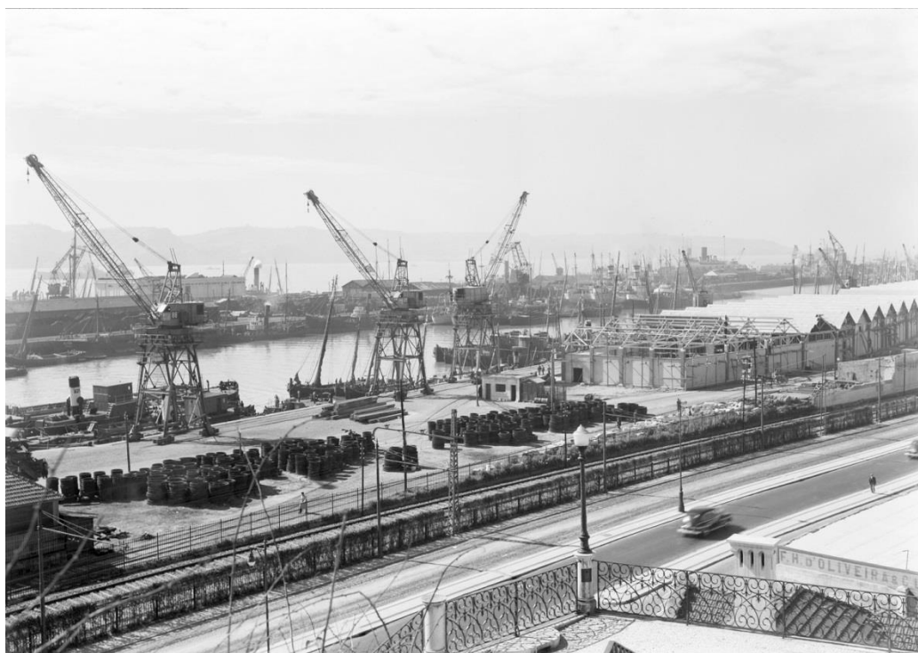
Figura 6. O cais real de Lisboa na primeira metade do século XX. 31

O cais sensacionista da “Ode Marítima”, anunciado no plano teórico, não é, porém, apenas uma heterotopia na sua dimensão de microcosmos universal. Trata-se também de uma espaço real (localizado) e virtual (cosmopolita; utópico) em que ambas as dimensões se justapõem na constituição de um modelo de cosmopolitismo territorializado. A identificação do espaço do cais enquanto heterotopia, definível como justaposição de espaços localizados e universais, emerge logo no início, a partir da subjectividade de Campos. Situado no cais concreto de Lisboa, Campos olha “pró indefinido” (Campos, 1915: 131). Enquanto a manhã começa como todas as outras manhãs reais do cais de Lisboa — “Aqui, acolá, acorda a vida marítima” —, a subjectividade de Campos, porém, está orientada para uma outra dimensão deste espaço: