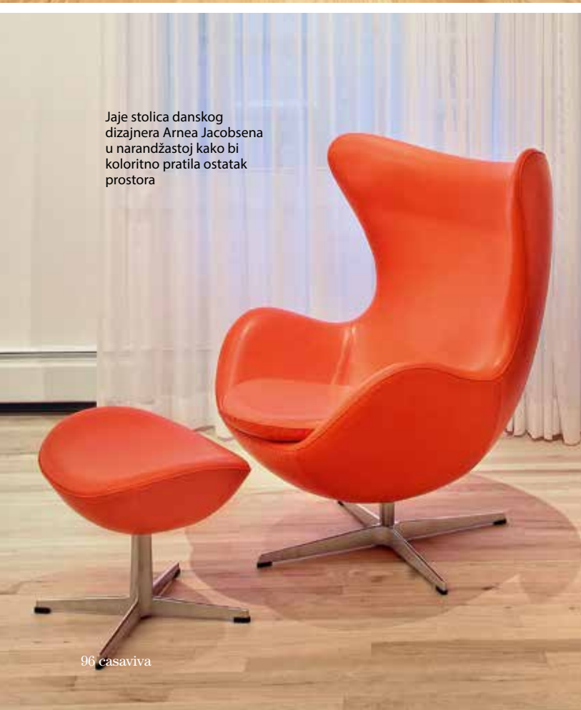
Jaje stolica danskog dizajnera Arnea Jacobsena u narandžastoj kako bi koloritno pratila ostatak prostora

Stil dizajnerke Ghislaine Vinas prepoznatljiv je po smeloj upotrebi printa i jarkim bojama. Ona je sama žitelj četvrti TriBeCa na Menhetnu, gde je 2000. osnovala kompaniju koja se bavi uređenjem prostora, tako da je dodatno razumela kako da živopisnost ovog dela grada predstavi kroz enterijer. Dupleks se nalazi u čuvenoj zgradi Dietz Lantern , u Ulici Greenwich, koja je izgrađena 1887. a 1996. pretvorena u kondominijum od 28 stanova. Zgrada je prvobitno bila fabrika u kojoj su se pravili fenjeri za kočije. Klijent i dizajnerka znali su se od ranije, s obzirom na to da im deca pohađaju istu školu. Pre samog rada na dekoraciji, dupleks od 330 kvadrata prethodno je morao da se prilagodi potrebama porodice koja u njemu živi. Tako je enterijer menjan u potpunosti. Iako prvobitan raspored prostorija nije promenjen, na svakom zidu urađena je manja ili veća intervencija. Kada su počeli sa merenjem, utvrđeno je da nijedan zid nije postavljen pod pravim uglom! Tamne nijanse broskog poda od javorovog drveta su ošmirglane kako bi se drvetu vratila prvobitna boja. Kuhinjski elementi su u potpunosti iščupani i zamenjeni novim. Stari nameštaj je poklonjen ili prodat i na kraju zamenjen novim komadima koji su se uklapali u koncept novog prostora. Ono što je poslužilo kao ideja iz koje se kasnije razvijao ceo projekat jeste činjenica da klijent voli dugine boje. Na samom ulazu u stan smešteni su klupa i komoda rađeni po meri obasjani neonskim znakom Solid Gold (čisto zlato)