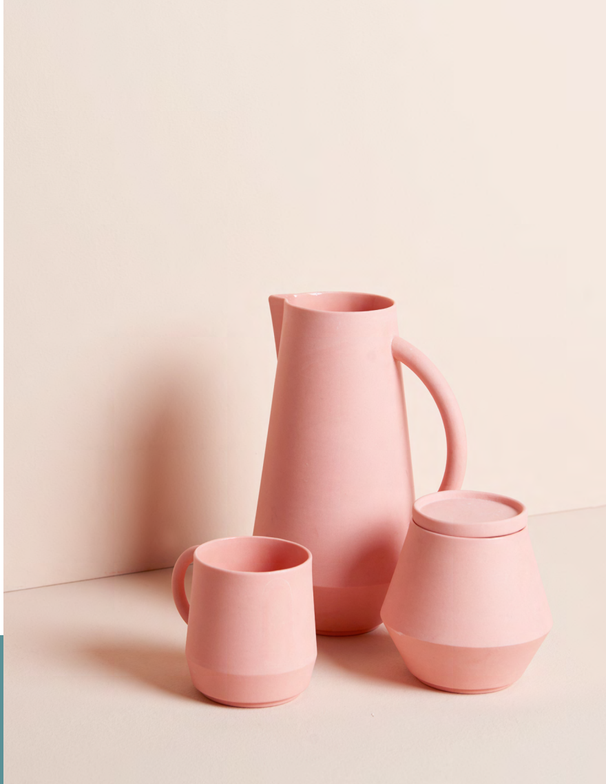
Unison - Tasse | Karaffe | Zuckerdose mit Deckel in koralle