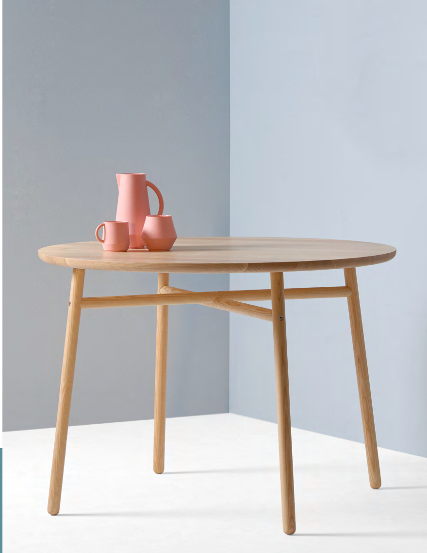
Fafa Table - round

designed by Julia Mülling & Niklas Jessen | 2016