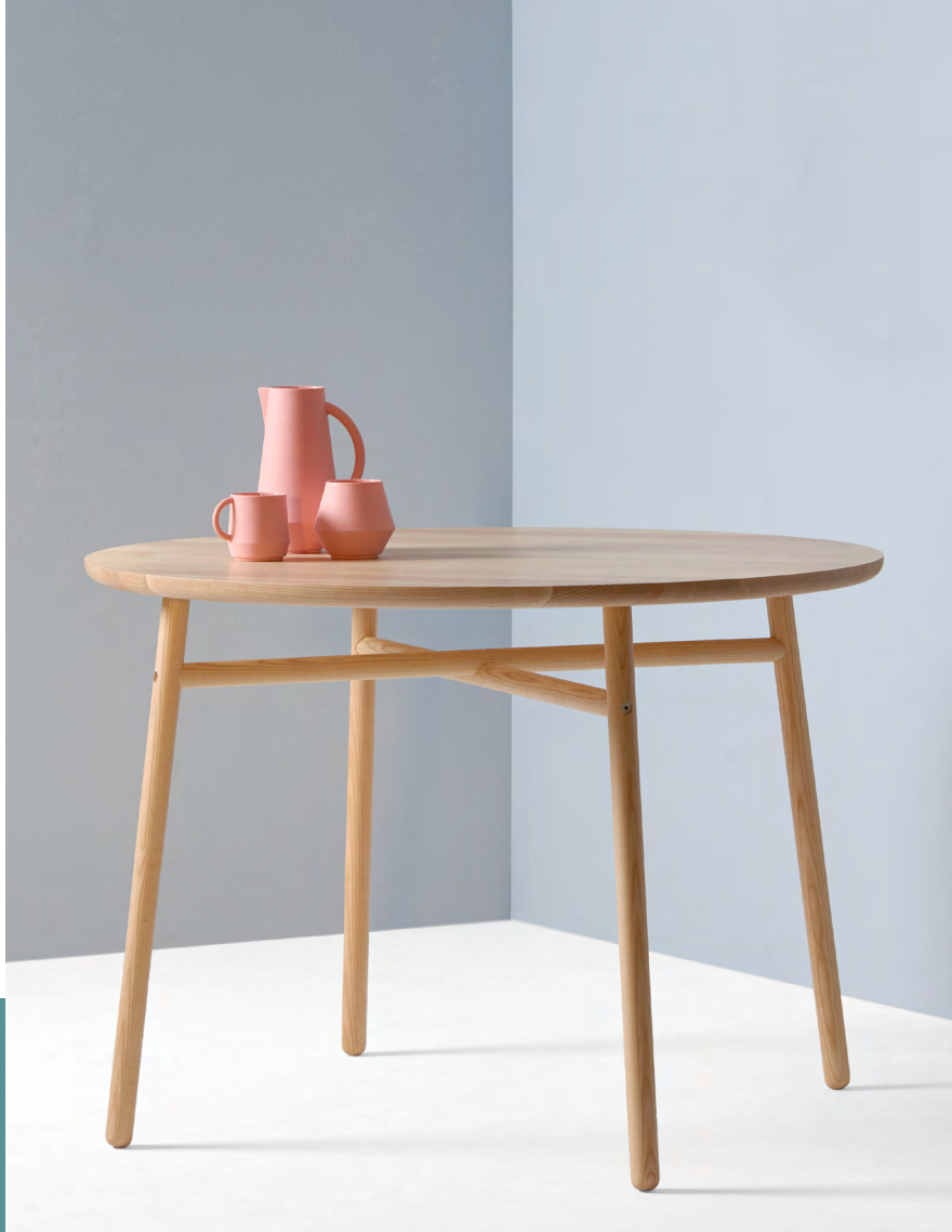
Fafa Tisch - rund