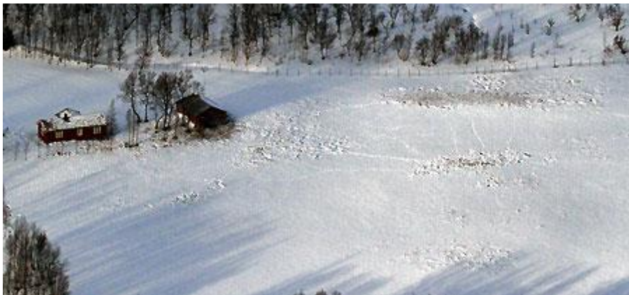
Tråkk etter tamrein på setervoll i Kjølidalen (Holtålen)