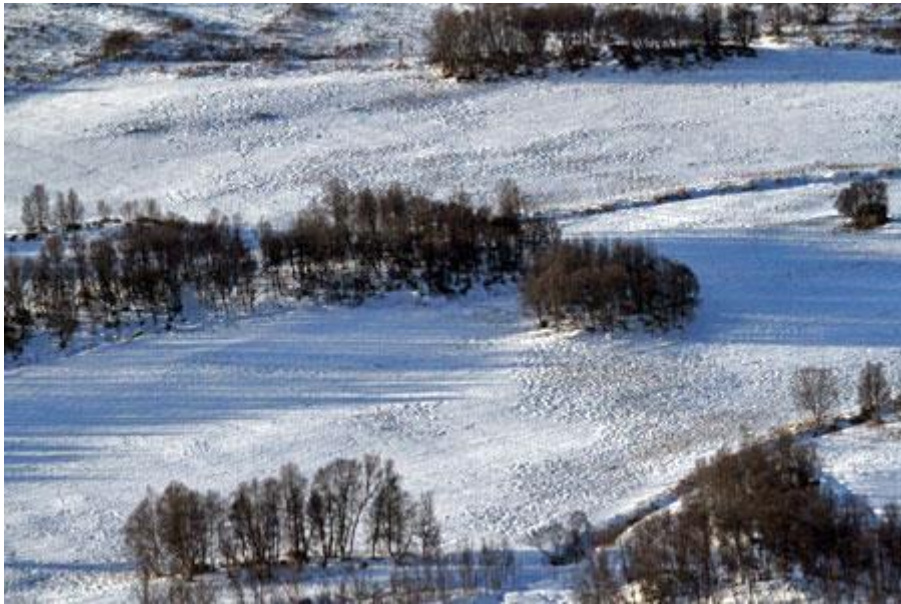
Tråkk etter tamrein på fellesbeitet i Kjurrudalen (Dalsbygda)

forsøk på samle dyrene for opptelling; tamreinen reagerer ikke på flydur til forskjell fra villreinen).