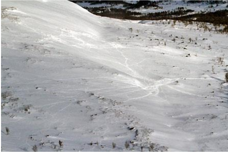
Spor opp mot toppen av Gruvhøgda (sørsida)