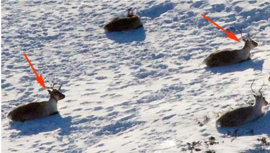
Bildet viser to simler som er merket.