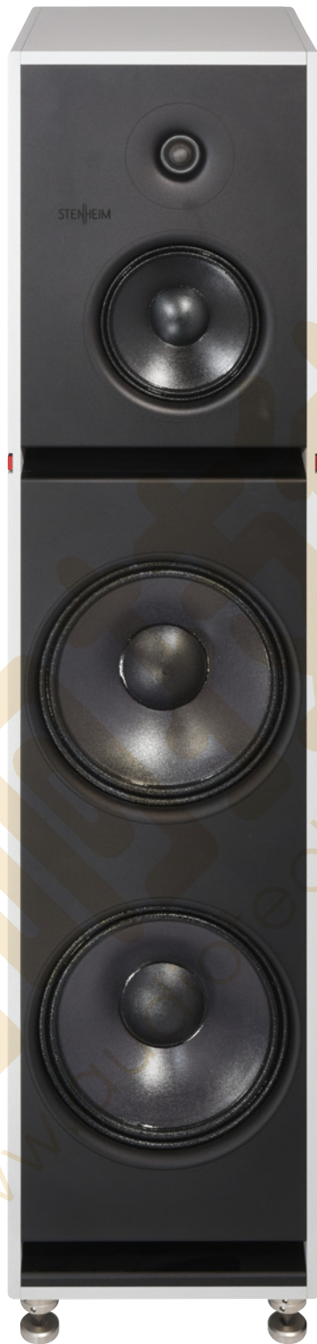
Alumine FIVE 規格

論外型和尺寸，我覺得Alumine FIVE最適合香港一般環境，所以STENHEIM這麼多個型號的揚聲器當中，我會最關注Alumine FIVE，當然要爭取機會試聽與讀者們分享。Alumine FIVE採用鋁合金作為聲箱在不同位置有不同厚度，前障板厚度是20mm，而其他部份是12 mm，這樣可使到聲箱有不同諧振點，減低聲箱共振的機會。Alumine FIVE聲箱是以陽極氧化處理外殼，秉承一貫瑞士出品，外觀相當簡潔，只有在揚聲器背板上才可以看到螺絲，而在聲箱兩側只有一條紅色橫條以作裝飾，據講這個條狀裝飾是有調聲作用，使到大平面的鋁板上有一條坑槽，減低鋁板本身的