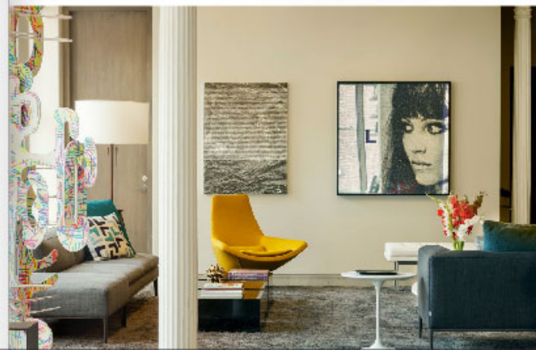
Интерьер гостиной дополняет мебель от именитых европейских брендов, среди которых диван Michel от B&B Italia, разработанный дизайнером Антонио Читтером, и кофейный столик Alice от компании Glas Italia, дизайн Жан-Мари Массо. Абстрактная работа художника Сема Морриса соседствует с женским портретом от Адама Пендлтона.

Угловая квартира площадью 315 кв. м, включающая три отдельных спальни с примыкающими к ним санузлами и гостиную, объединяющую кухню и столовую, благодаря своему выгодному расположению и планировке имеет две стены с панорамным остеклением. «В работе над этим