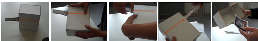
Abbildung 5: Interaktionskonzept für eine Box für ein Geburtstagsgeschenk für den fünfjährigen Neffen zur Überreichung des langersehnten Lego-Raumschiffs von Selina Maleska

Selina Maleska hingegen wählte für ihr Interaktionskonzept für "Eine Box für das Geburtstagsgeschenk für den Neffen zur Überreichung des langersehnten Lego-Raumschiffs" ganz andere Interaktionseigenschaften. Das Öffnen der Raumschiff-Geschenkbox sollte "schnell", "kraftvoll", "stufenlos" und "sofort" erfolgen. Anders als bei der Überreichung des Verlobungsringes ist hier nicht das Ziel, den Moment des Auspackens zu verzögern, sondern – zumindest aus Sicht des Beschenkten – möglichst schnell an den Inhalt der Box zu gelangen.