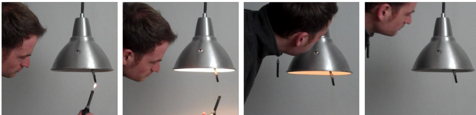
Abbildung 1: Anzünden und Auspusten der Kerzenlampe von Kai Eckoldt

schen Abendessen mit dem Liebsten, gerechter. So schafft die Kerzenlampe den Rahmen für ein persönlich bedeutungsvolles Lichtschalten – welches allerdings nicht immer und überall gewünscht wird. Wahrscheinlich haben wenige Menschen das Bedürfnis, den Moment des Beladens einer Waschmaschine ausgiebig zu zelebrieren, daher mag für die Beleuchtung des Waschkellers der klassische Kippschalter weiterhin die angemessenere Lösung sein. Selbst für eine technisch gleiche Funktion scheinen also je nach Kontext und adressierten psychologischen Bedürfnissen unterschiedliche Interaktionsformen eher angemessen. Entscheidend für die Ästhetik der Interaktion ist immer der Einklang von Interaktion und Erlebnis (Hassenzahl 2010). Auch wenn sich über den Sinn oder Unsinn der Kerzenlampe trefflich streiten lässt, verdeutlicht ihr Beispiel, dass die Interaktion mit einem Produkt – genauso wie seine Form oder Materialität – Bedeutung vermittelt, welche zu einer Veränderung des gesamten Erlebnisses führen kann und entsprechend gestaltet werden muss. Der vorliegende Beitrag stellt einen ersten Ansatz zur systematischen Beschreibung, Gestaltung und Bewertung der Ästhetik von Interaktion vor.