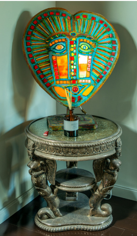
Les œuvres de Stanko peuvent être vues dans plusieurs maisons de Cordes, par exemple celle-ci est dans la maison de Guy Kremer.