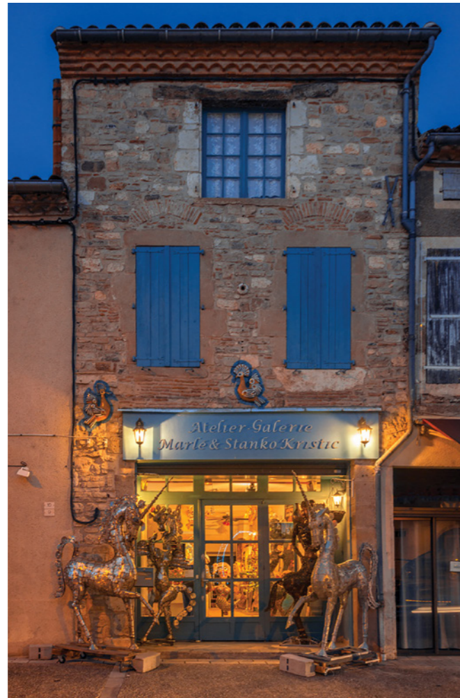
L'Atelier-Galerie 10 Place de la Bouteillerie.