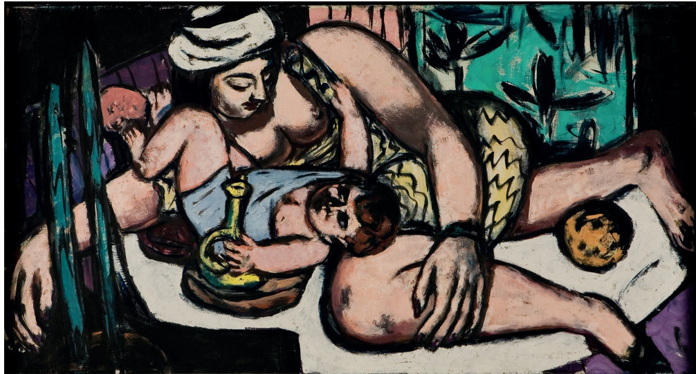
Max Beckmann, Mutter mit spielendem Kind, 1946 Kunsthalle Bielefeld.