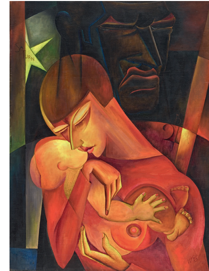
Hannah Höch, Frau und Saturn, 1922 Galerie Remmert und Barth, Düsseldorf.