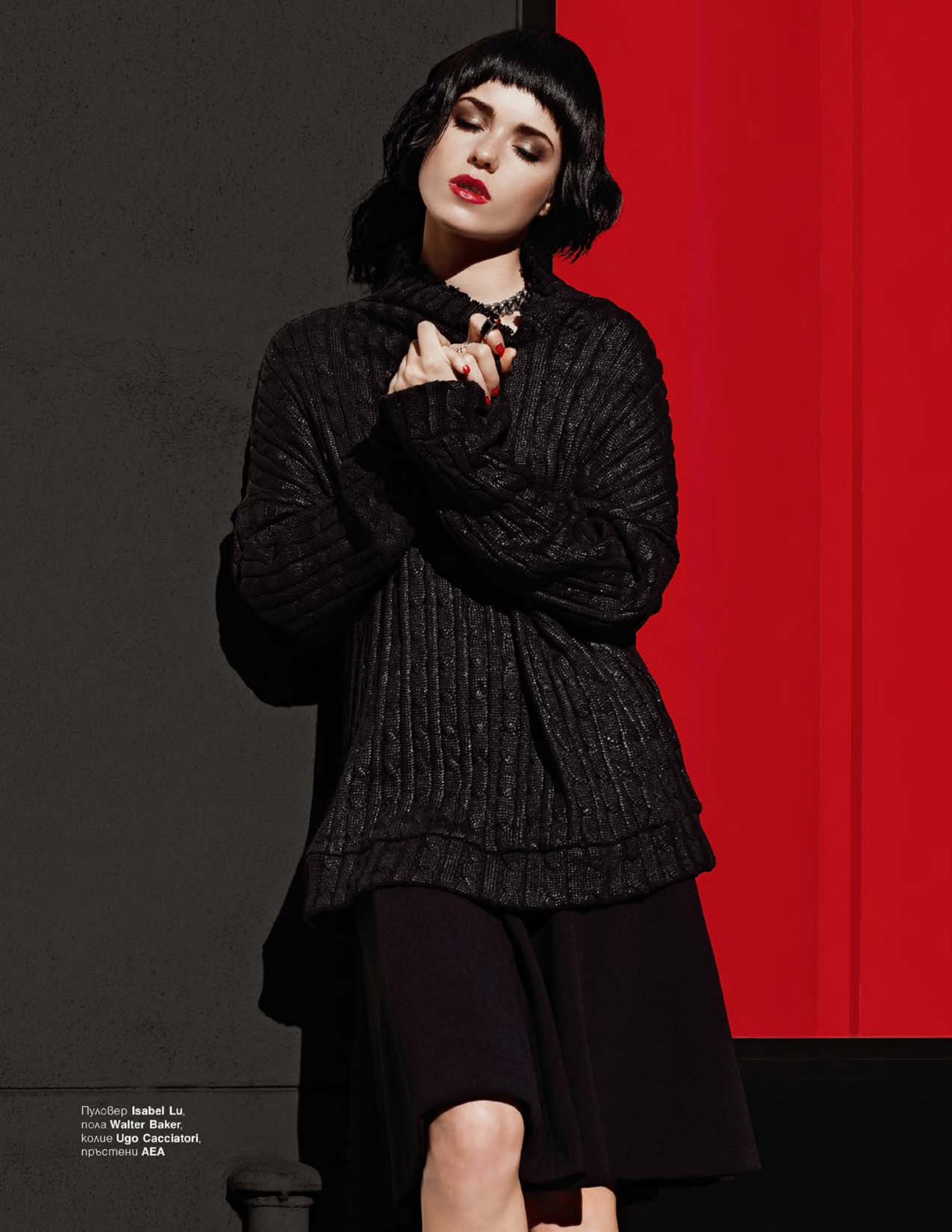
Пуловер Isabel Lu , пола Walter Baker , колье Ugo Cacciatori , пръстени AEA