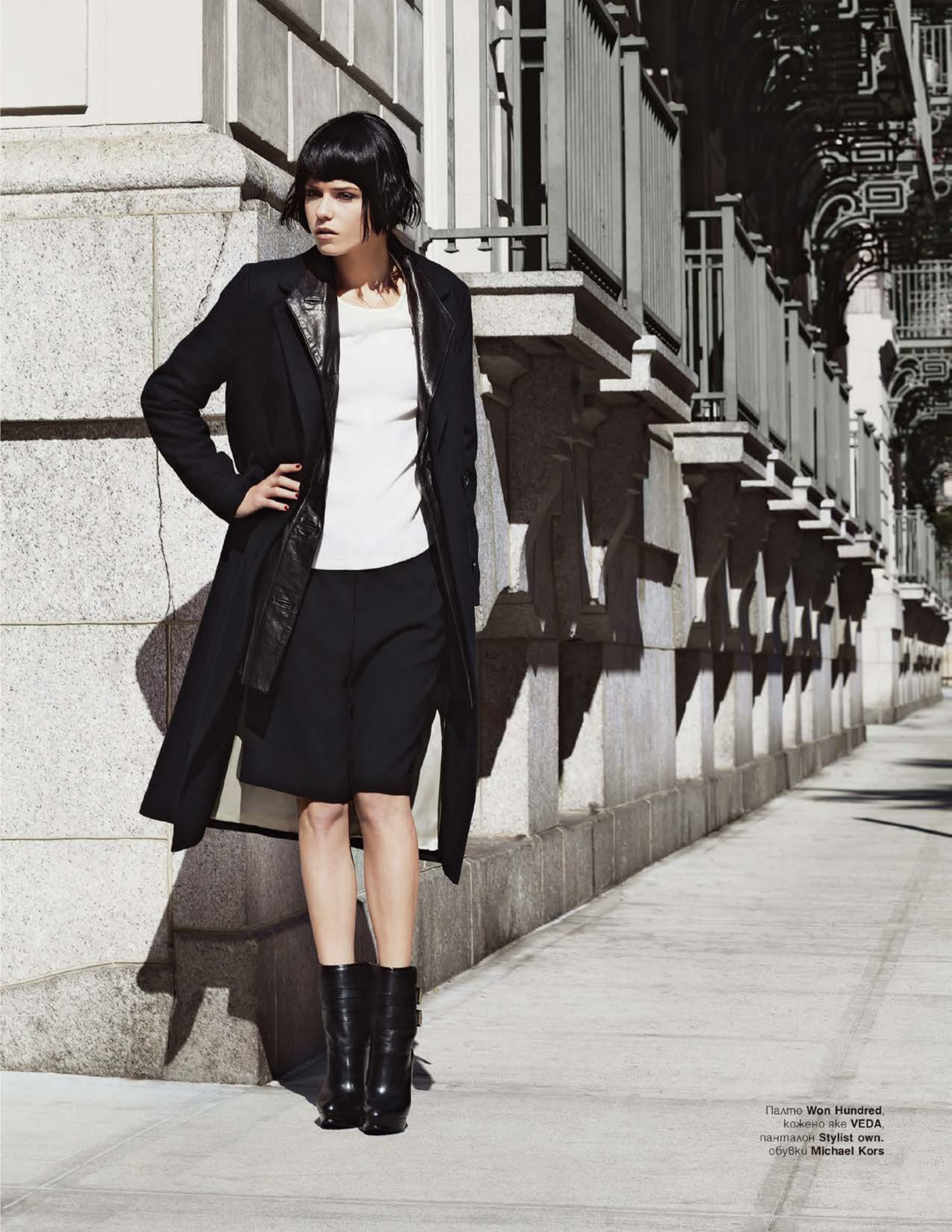
Палто Won Hundred , кожено яке VEDA , панталон Stylist own , обувки Michael Kors