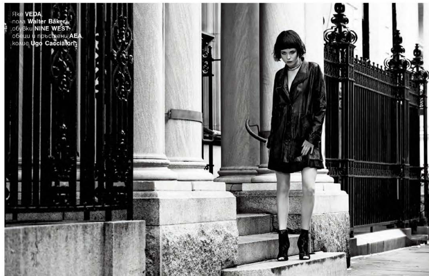
Яке VEDA , пола Walter Baker , обувки NINE WEST , обелци и пръстени AEA , колие Ugo Cacciatori