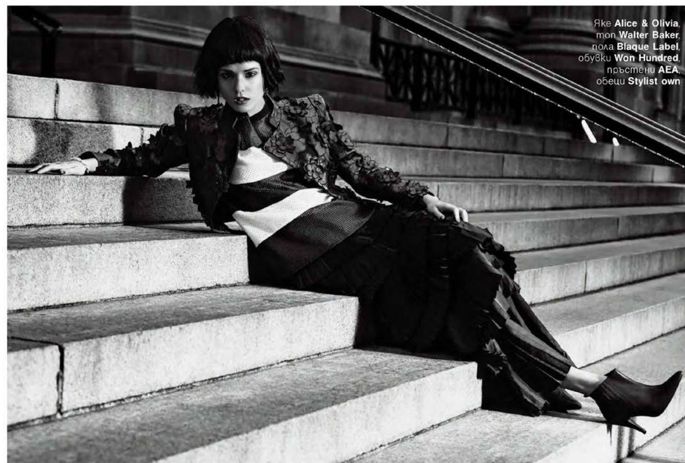
Яке Alice & Olivia , тон Walter Baker , пола Blaque Label , обувки Won Hundred , пръстени AEA , обелци Stylist own