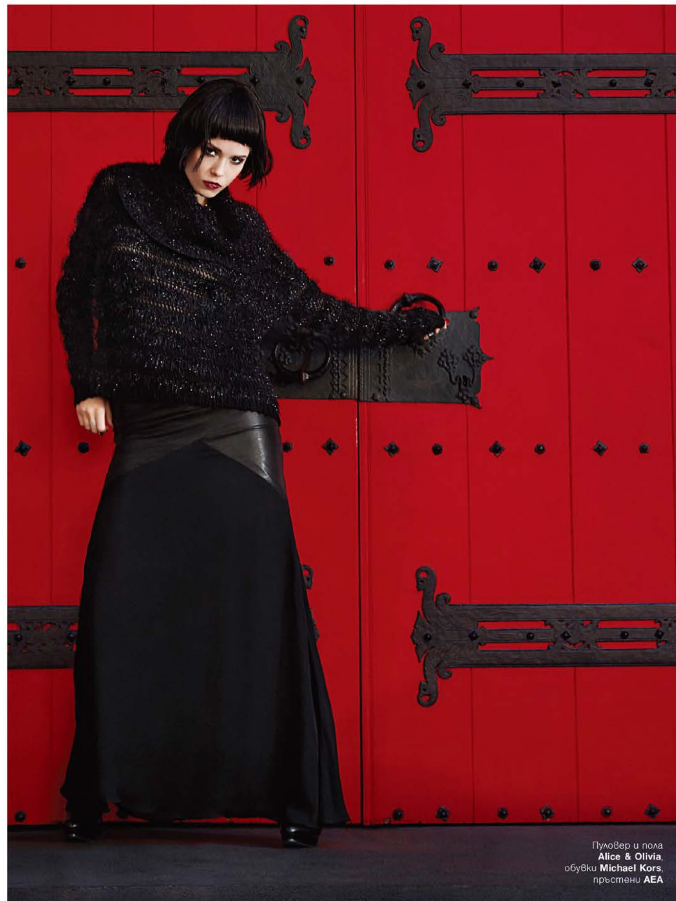
Пуловер и пола Alice & Olivia , обувки Michael Kors , пръстени AEA