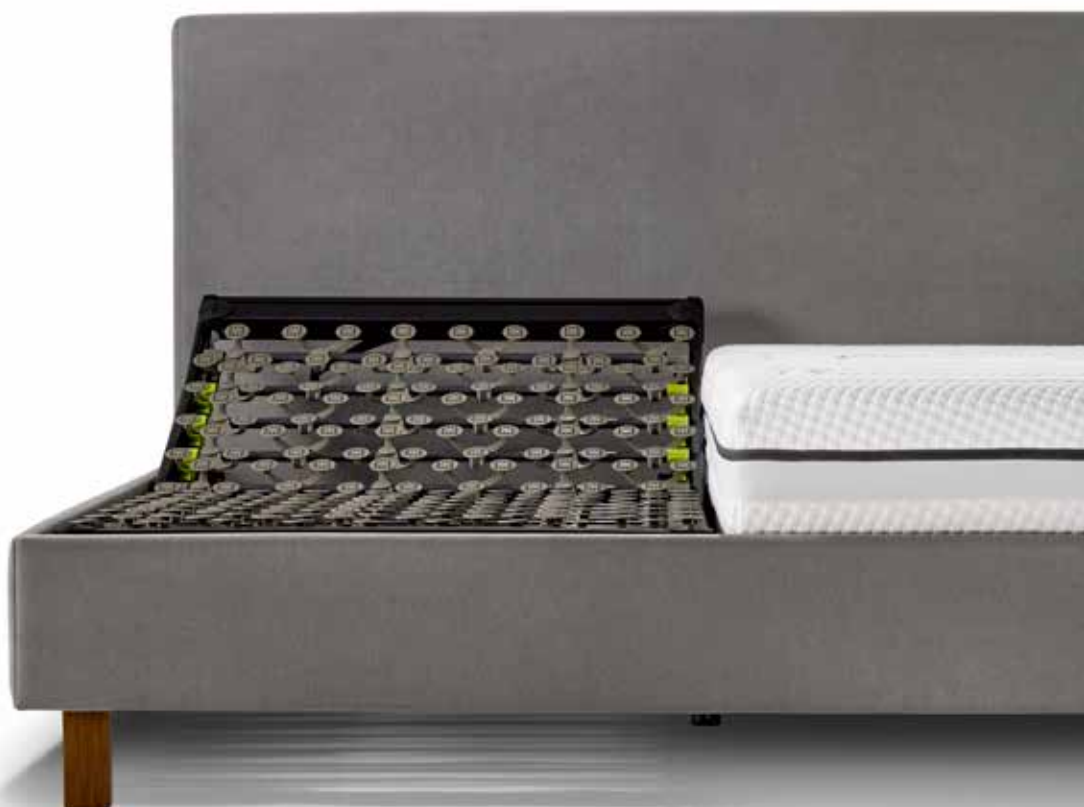
TÊTE DE LIT : VALENCIA, HAUTEUR 130 CM TISSU : JERSEY STEEL (CAT. 1) PIEDS : SQUARE WALNUT, HAUTEUR 15 CM