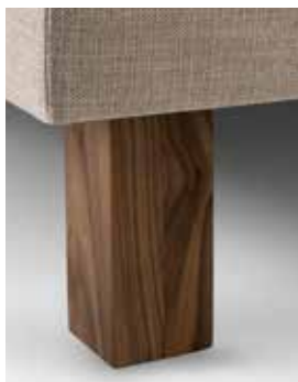
WOOD SQUARE HAUTEUR 10CM OU 15CM OAK OU WALNUT