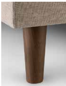
WOOD ROUND HAUTEUR 10CM OU 15CM OAK OU WALNUT