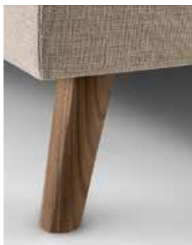
WOOD OBLIC HAUTEUR 10CM OU 15CM OAK OU WALNUT