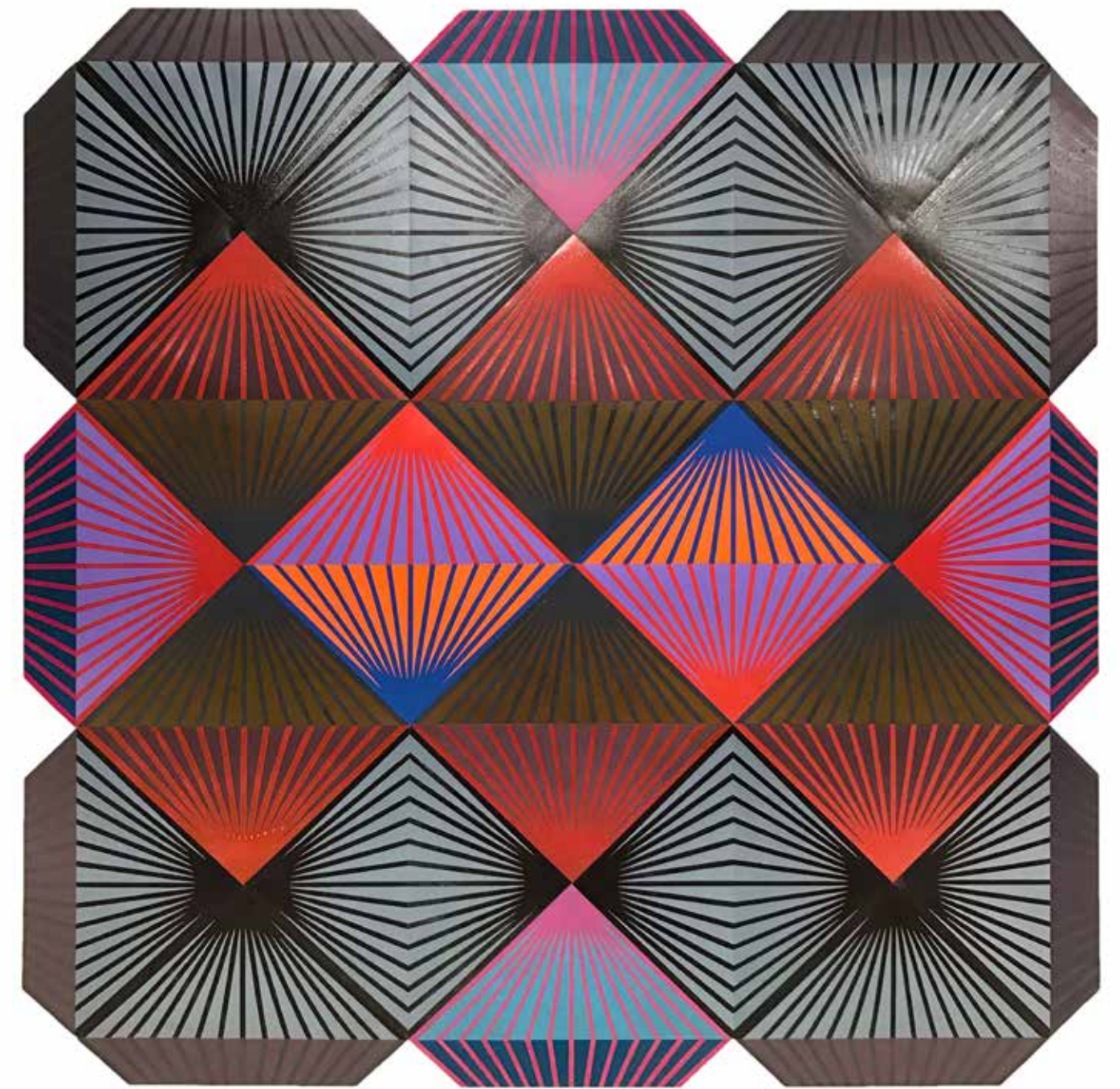
Shibboleth #2 , 2016, grabados en madera mono grabados en papel, conectados, 160.02 x 160.02 cm.