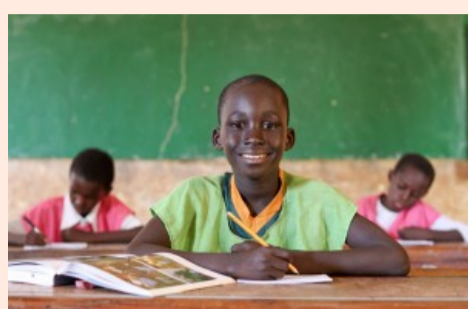
Bamako, Mali, 2010