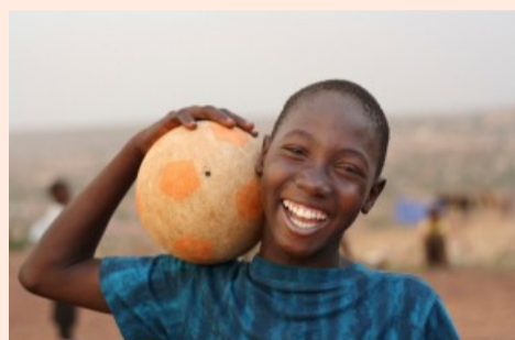
Bamako, Mali, 2010