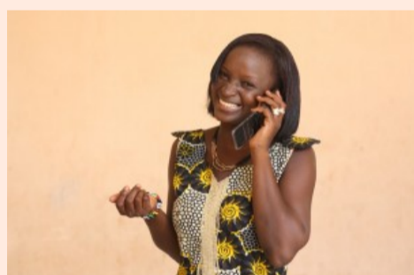
Bamako, Mali, 2010

"På Getty Images søger man via key words," forklarer Morten Nilsson, og CFP Bamako har i udgangspunktet arbejdet med emner som "Happiness, togetherness and friendship" i deres fotografier. Desuden har programmet sigtet mod at fange hverdagsituationer med alt fra fodbold, laptops og mobiltelefoner, der har ændret kommunikationen på det afrikanske kontinent så radikalt.