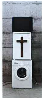
by Danh Vo