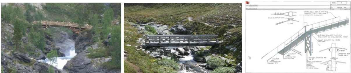
Figur 3. Eksempler på utleggsbru, stokkebru og hengebru