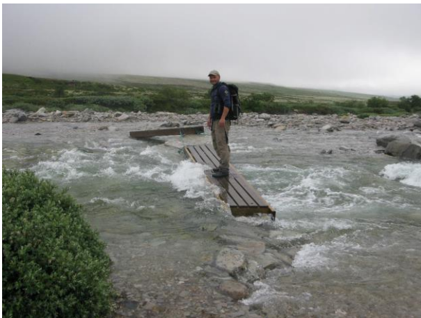
Figur 2. Bilde av dagens bruløsning over Vesle Ula sommeren 2015