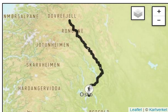
Figur 1. Rondanestien, se https://rondanestien.dnt.no/om/ for detaljer

Løypa skal ikke merkes utover den faste merkingen av Rondanestien. To eller tre følgebiler skal benytte veinettet som er tilgjengelig for allmenheten.