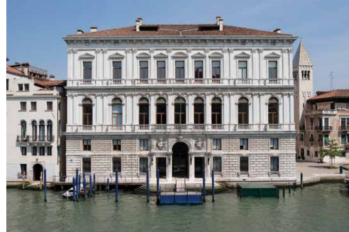
於2006年開幕的 Palazzo Grassi。