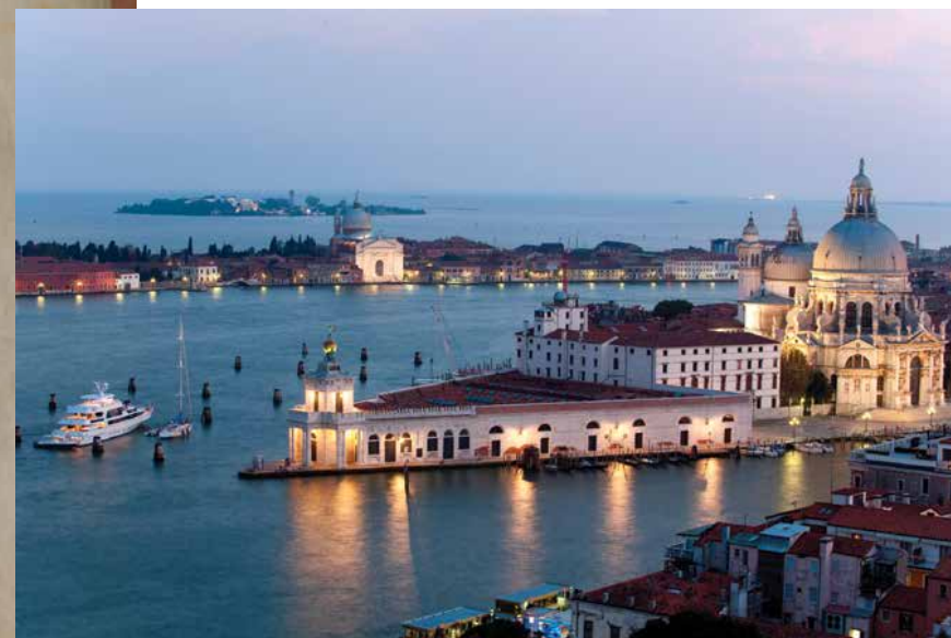
經翻新和改造後成為藝術館，位於威尼斯的舊海關大樓Punta della Dogana。