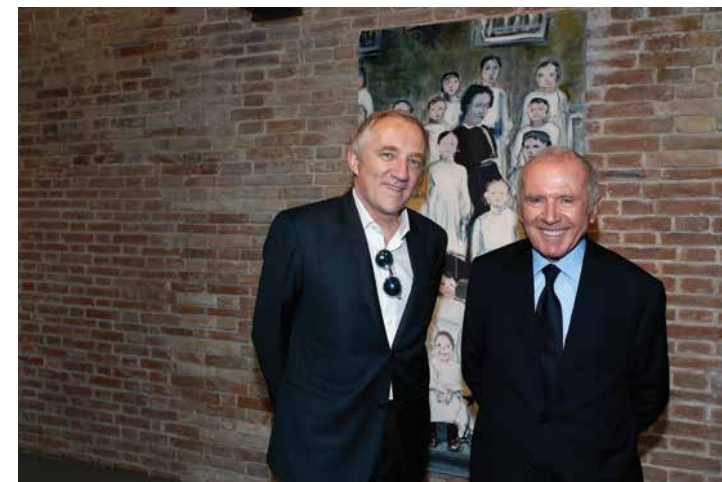
Pinault先生(右)與兒子一同出席Fondazione Pinault的開幕儀式。

眾所周知 François Pinault 是奢侈品世界的巨頭，而他的生平更是傳奇。他在 1936 年 8 月 21 日生於一個名為 Les Champs-Géraux 的小村莊。該小村莊到現時也只得一千多名居民。1963 年，當時只得 27 歲的他，在 Rennes 創建了一家木材貿易公司，隨後公司迅速發展，業務推廣至木材製造、入口、零售等範疇。1988 年公司正式上市。