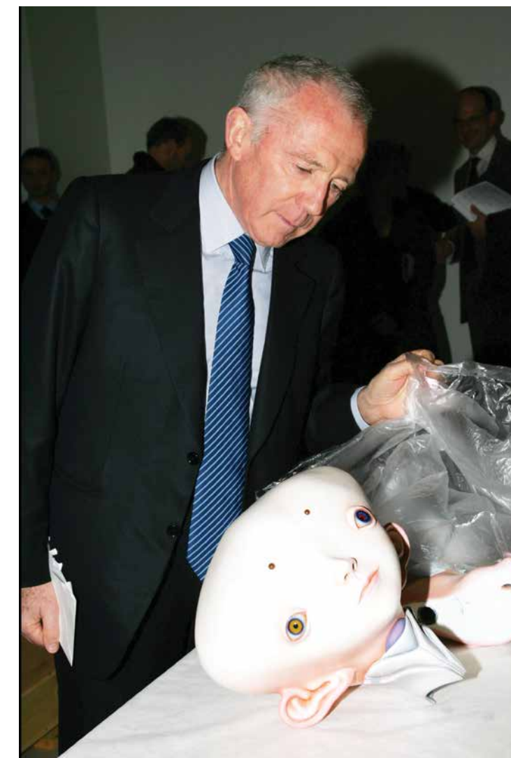
Pinault先生與其私人收藏的村上隆作品《Inochi》，攝於《Exclusive》展覽舉行前夕。

「藝術展精彩之處，在於它是一個了不起的空間，造就了交流、會合、以及藝術影響的交錯，又促進新思想、潮流的崛起。每一個藝術展，都可謂是當代藝術創作裏的一個櫥窗。」Pinault 先生表示，但凡有助推動藝術界發展的項目，他都會大力支持。今年 6 月，他公布將創立一個藝術家駐住計劃，旨在為藝術家提供更優越的創作空間；計劃選址於法國北部朗斯市——即是羅浮宮的分館所在城市——獲選的藝術家們將入住一間