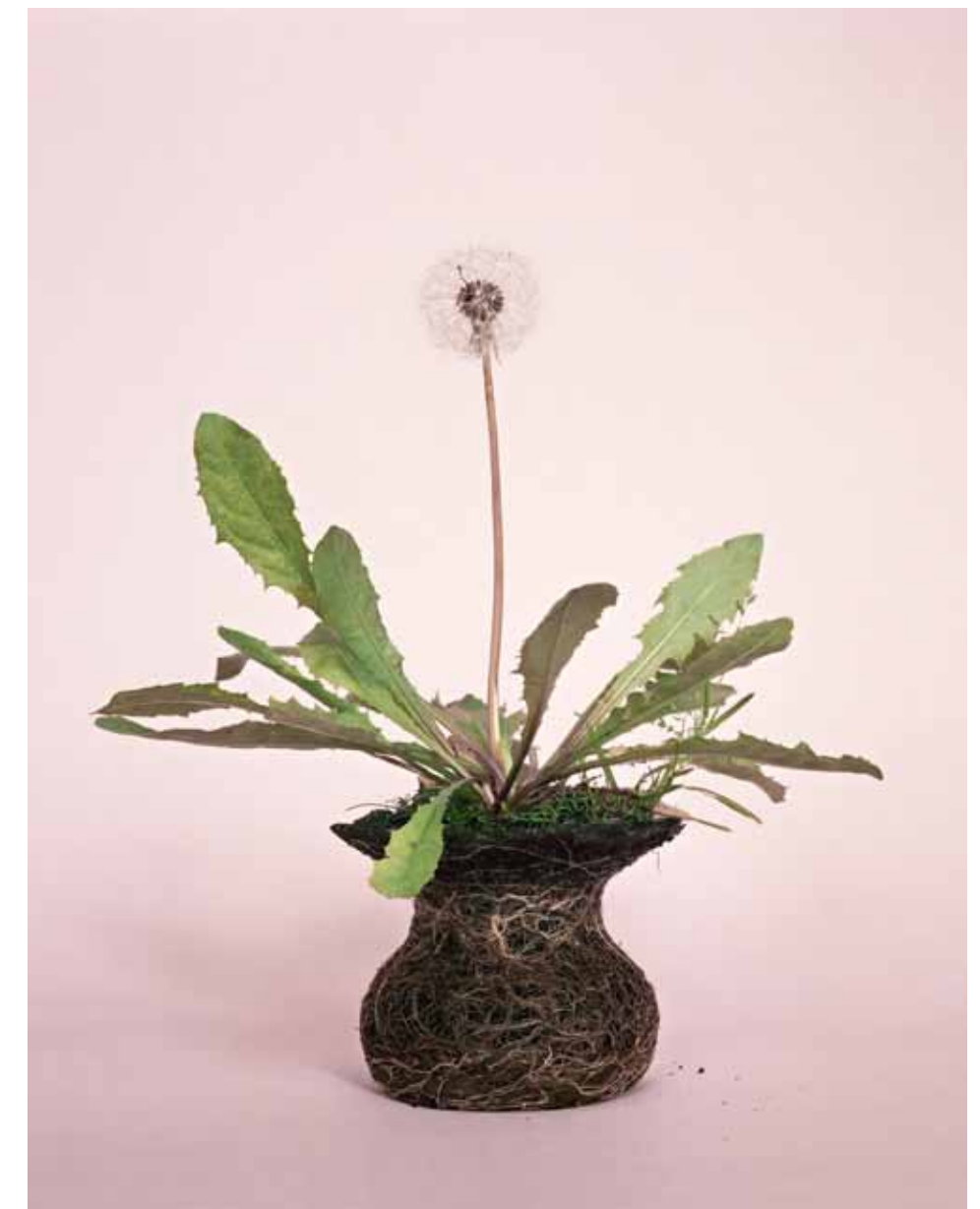
Nurture Studies, courtesy Seelevel Gallery. Foto: Diane Scherer

"Het is niet altijd strikt conceptueel. Op de Gerrit Rietveld Academie ben ik een paar keer geswitcht: van beeldende kunst naar grafisch en toen pas naar fotografie. Daardoor heb ik een meer 'semiconceptuele' manier van werken ontwikkeld."