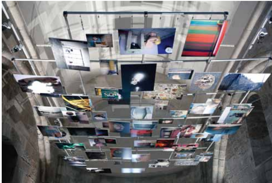
■ ■ Untitled (I've taken too many photos / I've never taken a photo). © Anouk Kruihof

"Alles wat ik doe, ontstaat vanuit een ideeëngolf. Dat idee kan een foto, een serie foto's of boek zijn. Hoewel ik een soort kaders aanleg waarbinnen ik werk, wijk ik tijdens het proces wel eens af. Als ik iets interessants tegenkom, reageer ik. In serendipity kunnen interessante dingen gebeuren. Het toeval durven toelaten creëert openheid en geeft mijn werk zijn losheid en speelsheid... denk ik althans. Ik ben dus geen conceptuele fotograaf in de strikte betekenis. Neem Empty Bottles van WassinkLundgren, een voorbeeld van strikte documentaire