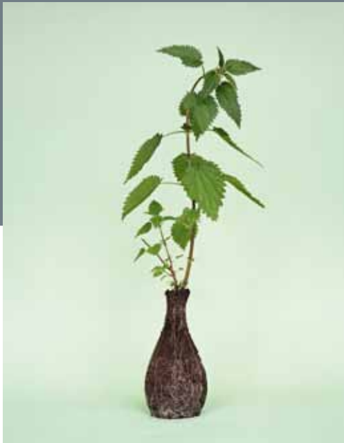
■ Nurture Studies , courtesy Seelevel Gallery. Foto: Diane Scherer