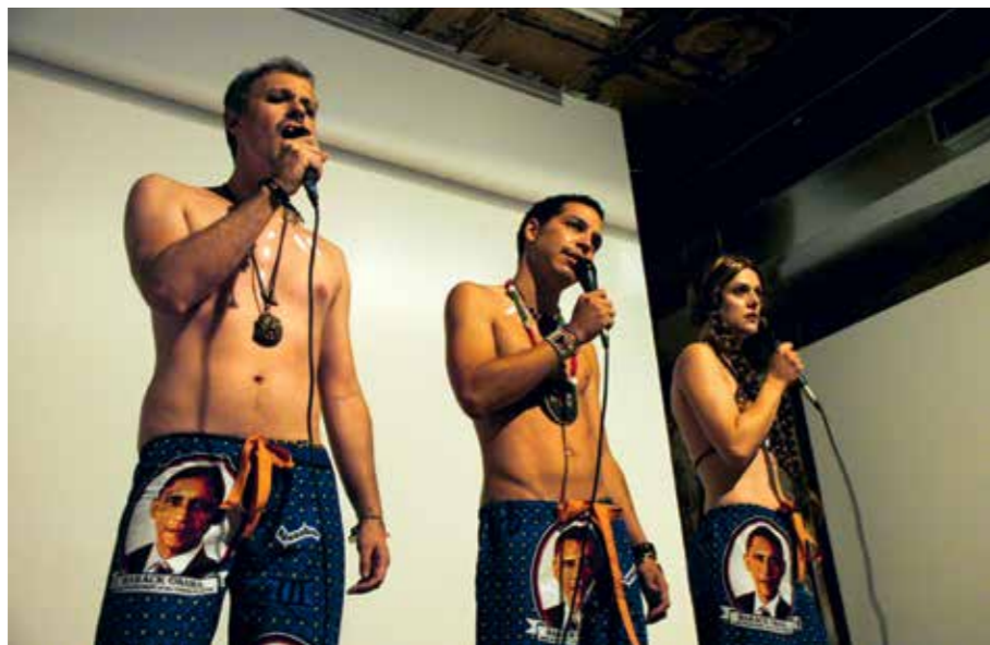
My Barbarian, Death Panel Discussion, 2009, opening performance van THE NIGHT EPISODE, 2009, courtesy Participant INC, New York