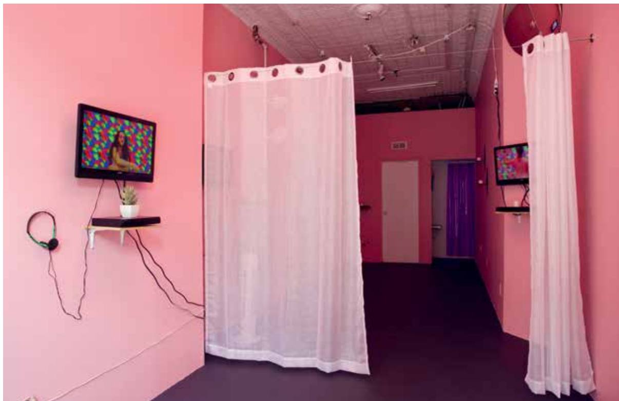
Abby Lloyd, A Slight Touch , 2015, courtesy Cleopatra's, Brooklyn, NY, foto Marc Tatti

met als doel jonge kunstenaars te ondersteunen en natuurlijk The Kitchen, dat begon als kunstenaarscollectief in 1971 met Woody en Steina Vasulka en twee jaar later was uitgegroeid tot een officiële non-profit ruimte, waar nog steeds experimentele kunstenaars hun vooruitstrevende ideeën met gelijkgestemde collega's kunnen uitwisselen. Naast deze