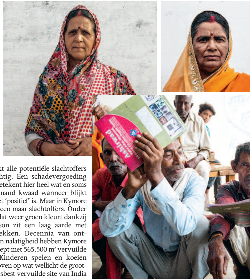
↑ De asbestslachtoffers moeten een strijd leveren van David tegen Goliath.

'Wanneer de Belgen langskwamen, spraken ze niet met de arbeiders. Ze gaven ons wel wat maskers en handschoenen, maar niets dat ons daadwerkelijk kon beschermen.'