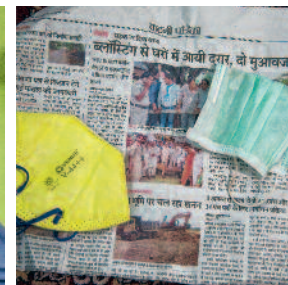
De asbest-maskertjes van Eternit.