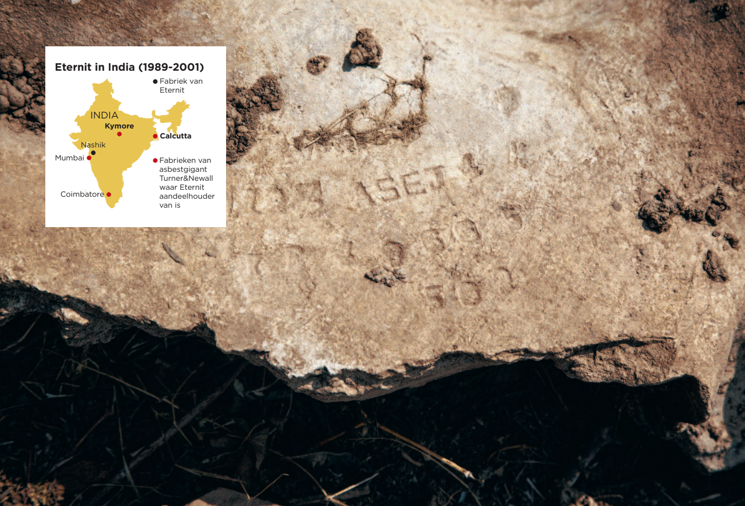
ASBESTAFVAL ligt in de velden rond het dorpje Kymore.