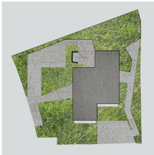
Situacija (arhitektonski nacrt)