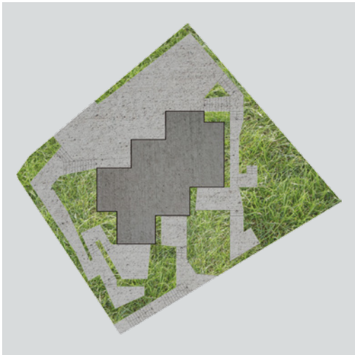
Situacija (arhitektonski nacrt)