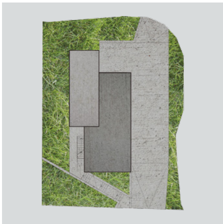
Situazione (nello schizzo architettonico)