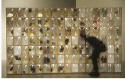
Esperanza Mayobre Colirio (Eyedrop) , 2004. Mixed Media. 7ft. x 12ft. x 24in. Installation view. Técnica mixta, 213,3 x 365,7 x 61 cm. Vista de La instalación.

same way that one cannot enter the illusionistic space of the skyscrapers, one cannot enter the real space of an art gallery, even more so because the gallery is the fence! All the sculpture, both on and off site, challenges one's inclination to enter familiar spatial constructs that, in reality, can only be imagined.