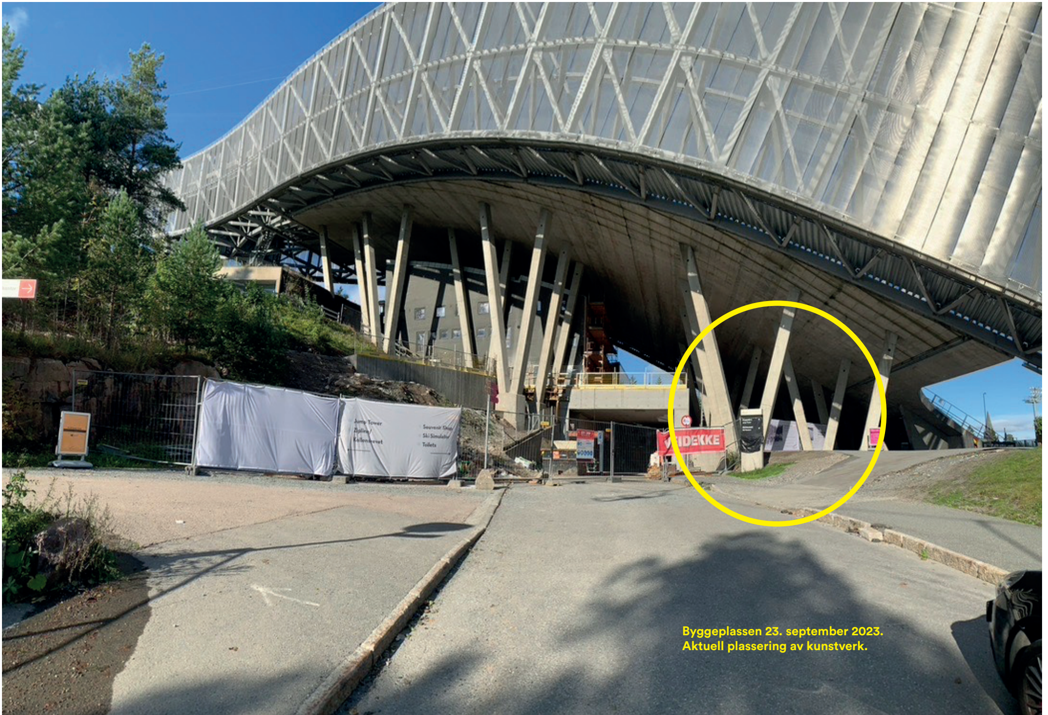
Byggeplassen 23. september 2023. Aktuell plassering av kunstverk.