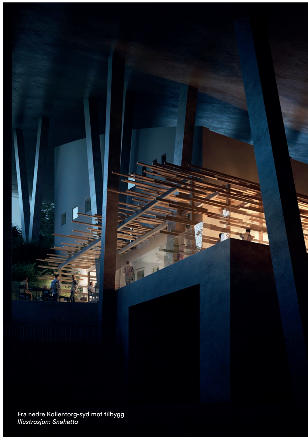
Fra nedre Kollentorg-syd mot tilbygg Illustrasjon: Snøhetta

Oppdraget gjennomføres i tråd med Norsk Billedhoggerforenings konkurranseregler.