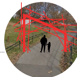
Holmenkollen Stasjon Adkomst fotgjengere