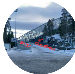
Parkering Adkomst for bil og buss