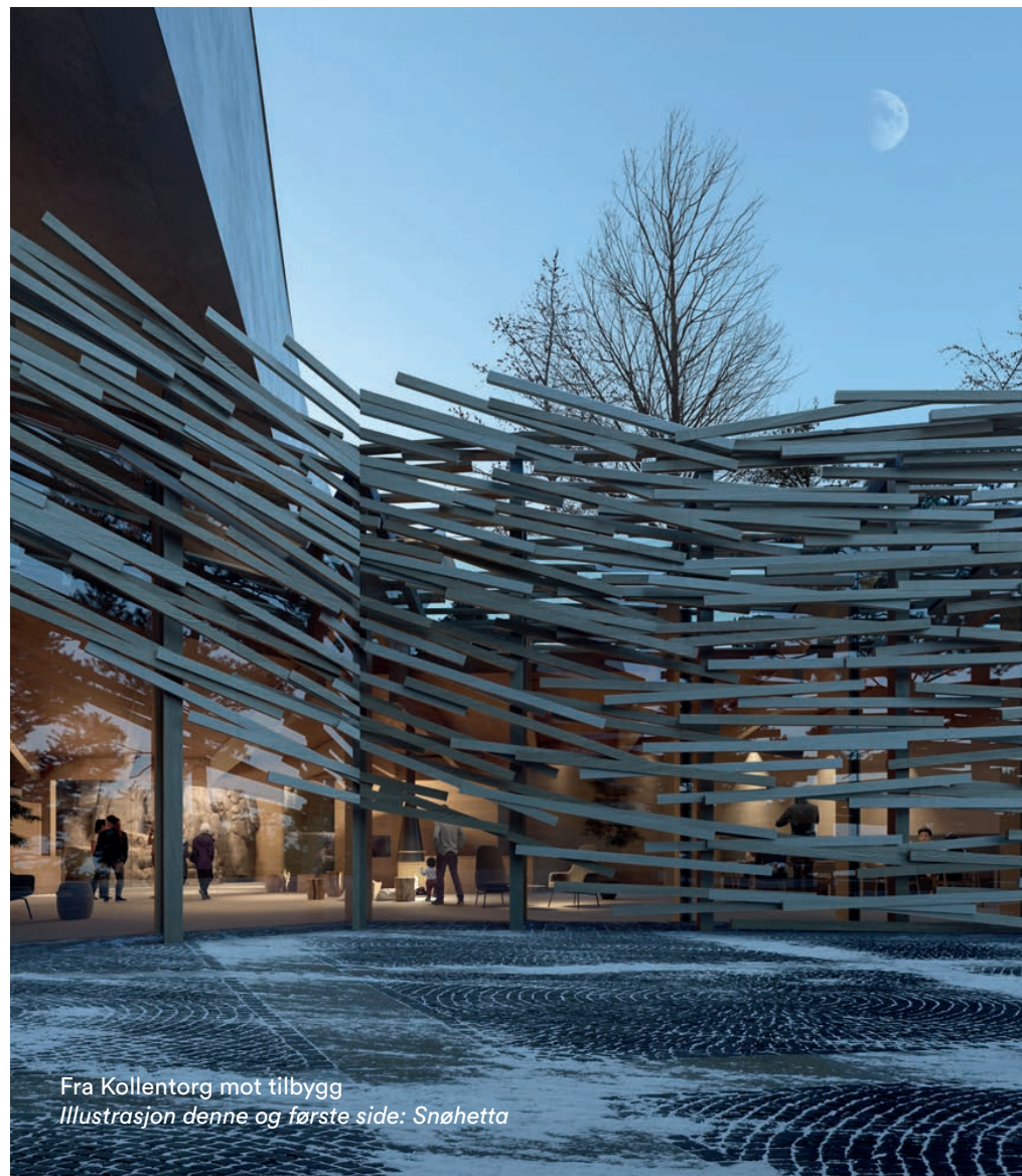
Fra Kollentorg mot tilbygg