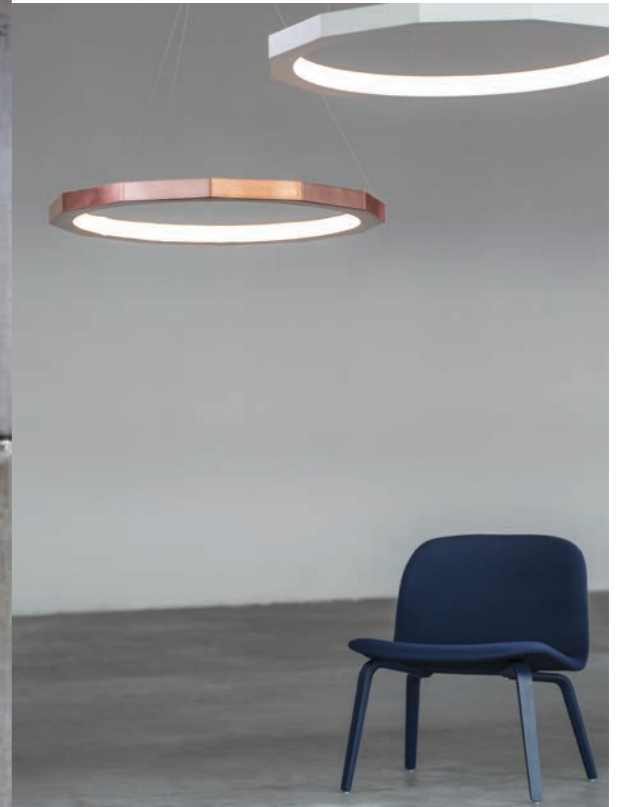
De izquierda a derecha Lámpara de aluminio Halo con acabados en oro de 24 quilates. Candelabro de cobre Dawn. Lámpara de acero Dodeca.