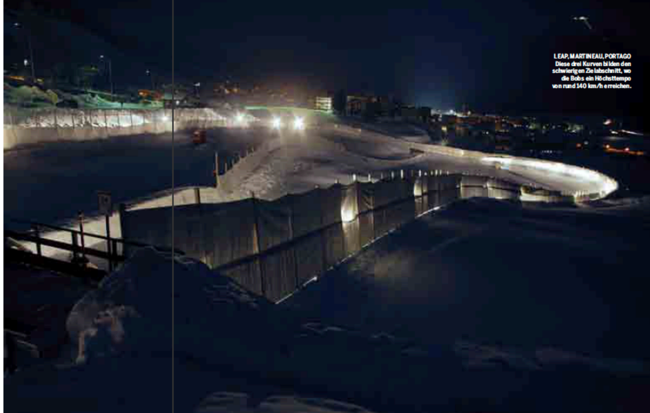
LEAP, MARTINEAU, PORTAGO Diese drei Kurven bilden den schwierigen Zielabschnitt, wo die Bobs ein Höchsttempo von rund 140 km/h erreichen.