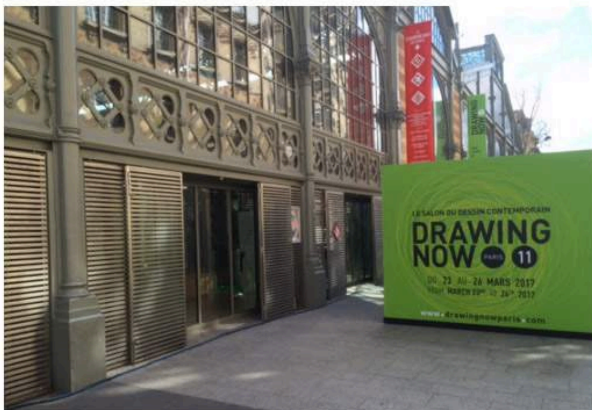
Façade du Carreau du Temple, Drawing Now 2017.

Chaque année, au printemps, la ville de Paris se place sous le signe du dessin contemporain. L'événement le plus important est « Drawing Now », au Carreau du Temple . Depuis 2007, il propose au grand public et aux collectionneurs une rencontre unique avec le médium dessin sous toutes ses formes. Cette année, les organisateurs présentent 72 galeries dont 40% d'exposants internationaux, avec cette fois-ci l'arrivée de nouvelles contrées, de l'Afrique à la Corée, du Portugal à la Hongrie. Pour cette 11 e édition, le salon est donc très international. Face à un monde qui semble se fissurer un peu, à la montée des extrémismes et aux craintes écologiques, les artistes jettent-ils leurs angoisses ou leurs colères sur la feuille blanche ? Ou bien le dessin fait-il encore rêver ? Et bien j'ai hâte de le savoir. En fait, je me pose peut-être les mauvaises questions, car le dessin échappe à toute définition. C'est avant tout un espace de liberté et c'est pour cela, que depuis de nombreuses années, il a trouvé sa clientèle, toutes générations confondues. Allez, je me faufile dans le métro, direction la grande verrière du Carreau du Temple. Devant la façade principale, un grand panneau vert signale le salon du dessin, impossible de le rater.