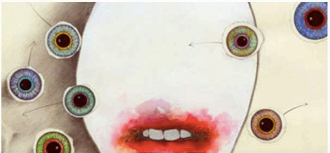
Joël Kermarrec : sans titre (détail). Courtesy galerie Papillon

Le Carreau du Temple présente jusqu'au 26 mars 2017, Drawing Now. Toutes les tendances du dessin contemporain sont représentées. Un rendez-vous où amateurs, collectionneurs, professionnels et artistes se retrouvent. 20% des galeries exposent pour la première fois sur le Salon. Année après année, le dessin a su s'imposer dans les foires internationales et les galeries. Aujourd'hui, il affiche sa liberté et son savoir-faire. Visite.