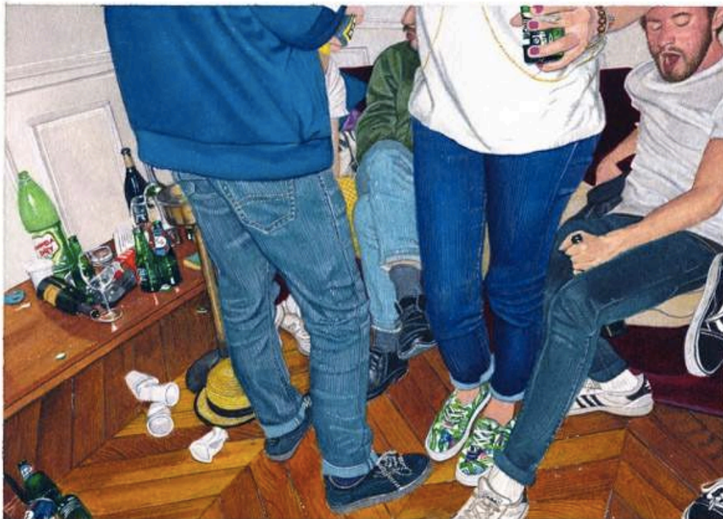
Thomas Lévy-Lasne : Fête numéro 76, 2016. Aquarelle sur papier, 15 cm x 20. Courtesy galerie Backslash