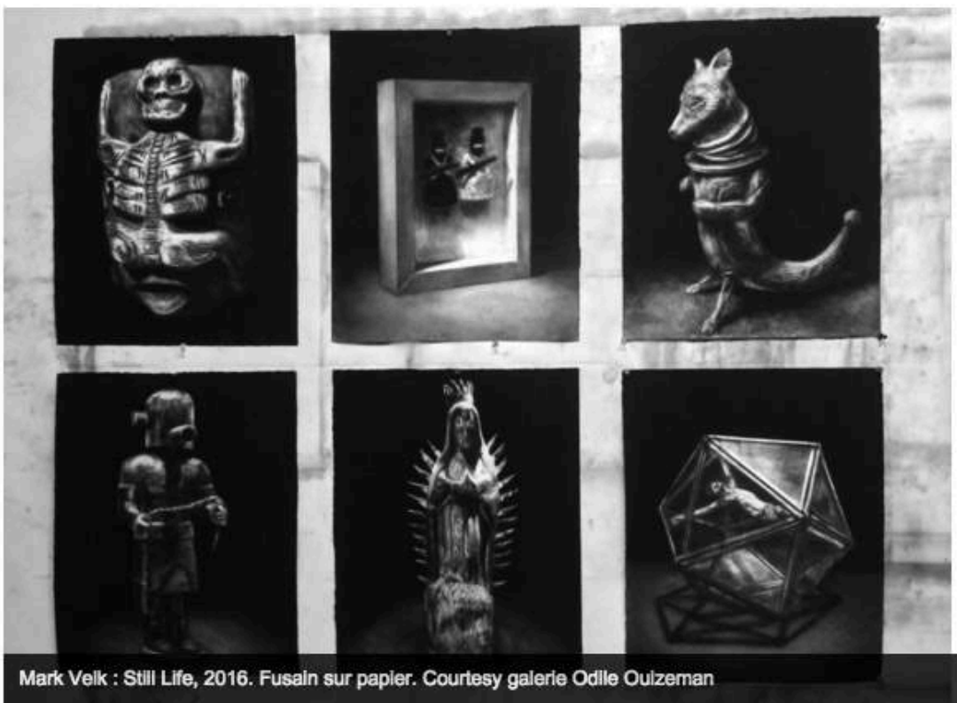
Mark Velk : Still Life, 2016. Fusain sur papier.