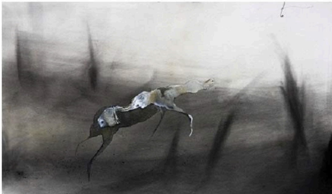
Lionel Sabatté : Caresse bolsée, 2016. Charbon, médium acrylique et curcuma sur papier. 80 cm x 120.

A la galerie C, Lionel Sabatté essaye de rendre le dessin sculptural. Il utilise de curieux matériaux : poussière, bronze oxydé, décomposition d'organismes marins, charbon, curcuma, sans oublier un mélange d'acrylique et de pétrole. Son travail édifie un pont avec l'art pariétal préhistorique. Il nous ramène à l'essentiel, au commencement, à l'organique, aux profondeurs abyssales du début de notre planète. Cet artiste audacieux, né en 1975 à Toulouse, s'amuse subtilement avec l'histoire de l'humanité. Il vient de remporter le prestigieux prix Drawing Now 2017. En 2016, Lionel Sabatté a été nommé vainqueur du prix Patio de La Maison Rouge, haut lieu de l'art contemporain, que j'évoque régulièrement dans ce blog.