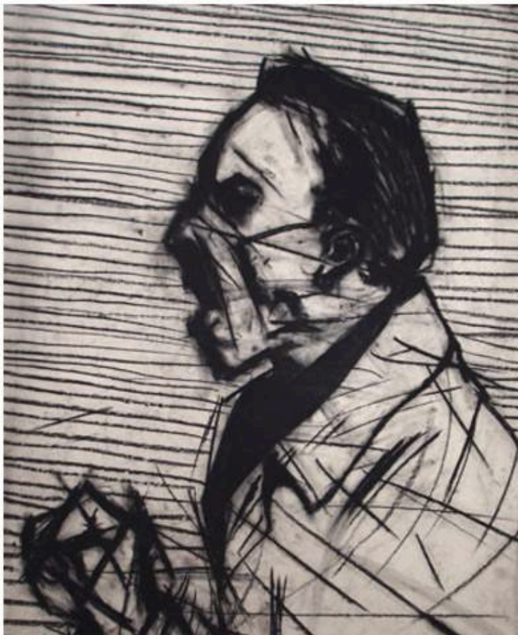
Stéphane Mandelbaum : Goebbels circa, 1980. Fusain sur papier, 73 cm x 55. Provenance : famille de l'artiste / Galerie Tristan