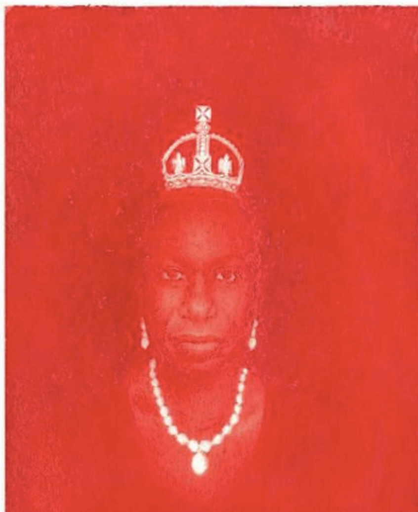
Pedro A.H Paixao : Petite couronne de diamant (Nina Simone in mémoriam), 2015. Crayon de couleur sur papier, 20,9 cm x 14,8.

La première illustration de ce que je viens d'affirmer, je la trouve à la Galeria 111 . Elle présente un artiste qui travaille uniquement au crayon de couleur rouge : Pedro A.H Paixao . Il peut mettre quatre ans à réaliser un petit dessin. C'est la pression de la main sur le crayon qui détermine la force du trait. Pour mieux me rendre compte de la prouesse technique, la galeriste me propose une loupe. Sur ce dessin, Pedro A.H Paixao rend hommage à la star du Jazz : Nina Simone