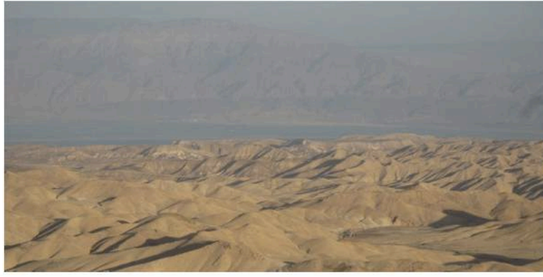
Chantal Akerman

A partir du 14 septembre la galerie Marian Goodman présentera deux installations vidéo de l'une des figures de proue du cinéma moderne, Chantal Akerman, artiste belge disparue à Paris en 2015 , à l'âge de 65 ans. Inspirée à ses débuts par le travail de cinéastes expérimentaux américains, elle cherchera tout au long de sa carrière à s'affranchir des étiquettes et sera traversée par des questionnements profonds, historiques et formels, chacune de ses créations mêlant savamment la création filmique et l'installation vidéo.