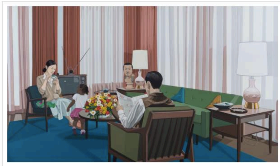
Chen Fei

Trois solos-shows attendent les visiteurs de la galerie Perrotin pour la rentrée de septembre. Chen Fei, artiste chinois né en 1983 se définissant lui-même comme outsider , a développé un style unique et reconnaissable entre mille. Surtout réputé pour ses peintures déroutantes, Chen Fei se joue des symboles. Il confronte les cultures, lui-même ayant étudié les Beaux-Arts et surtout fréquenté les salons de tatouage et la scène musicale punk pékinoise. En résulte des peintures aux récits captivants, dont l'iconographie emprunte au style de la bande-dessinée.