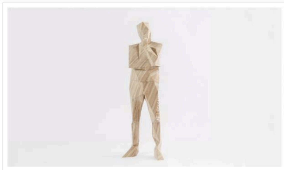
Xavier Veilhan

Xavier Veilhan est également invité par la galerie Perrotin pour une septième exposition, dans la continuité du projet qu'il présente jusqu'en novembre au Pavillon français de la Biennale de Venise , où l'artiste explore les liens entre approche plastique et collaboration musicale. Avec Flying V (tiré du nom d'un célèbre modèle de guitare), Xavier Veilhan trace de nouveaux liens entre architecture et musique avec de nouvelles œuvres signatures, à l'instar de ses silhouettes facettées de Renzo Piano et Richard Rogers.