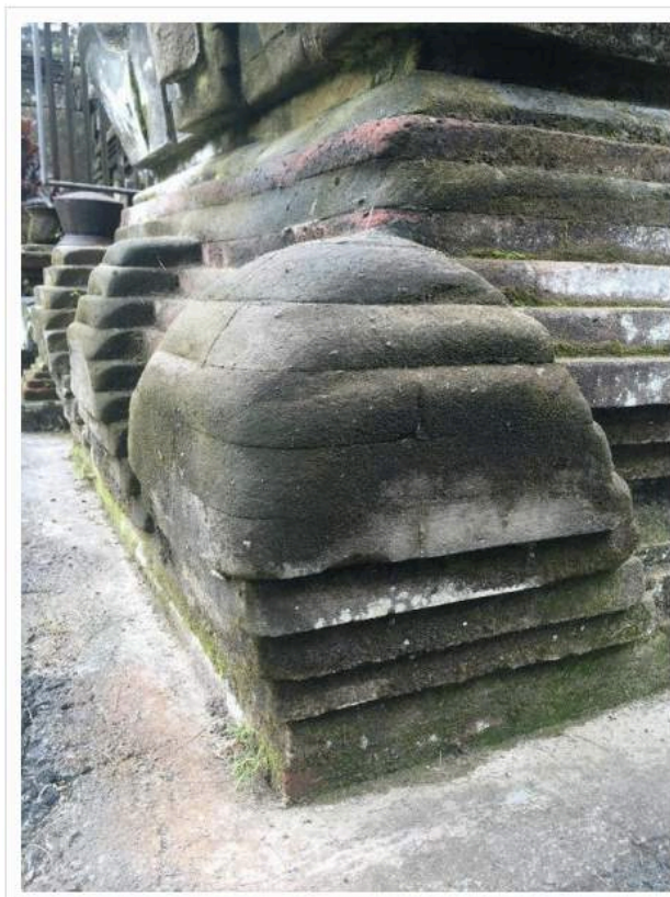
Gabriel Orozco