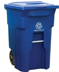
Blue Mixed Recycling Cart Bote de Reciclaje Mixto Azul