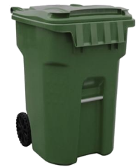
Green Organics Cart Bote de Orgánicos Verde