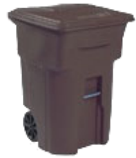
Brown Trash Cart Bote de Basura Marrón

Servicios Residenciales de Basura y Reciclaje