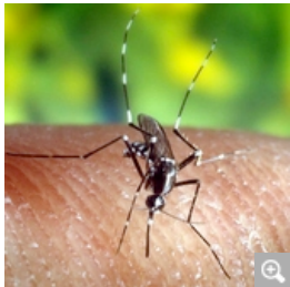
Malaria-Stechmücke: Die Erkenntnisse der Wissenschaftler bieten vielleicht einen Ansatz für neue Therapien.

HB DÜSSELDORF. Jetlag macht nicht nur Menschen müde, er schwächt auch Malaria-Erreger. Zu diesem Ergebnis kommen britische Forscher nach einer Studie bei Mäusen, die mit Malaria infiziert wurden. Bei Malariaparasiten, die ihren Lebensrhythmus nicht dem der infizierten Nagetiere angepasst hatten, verminderte sich Fähigkeit, die Krankheit zu übertragen, um die Hälfte.