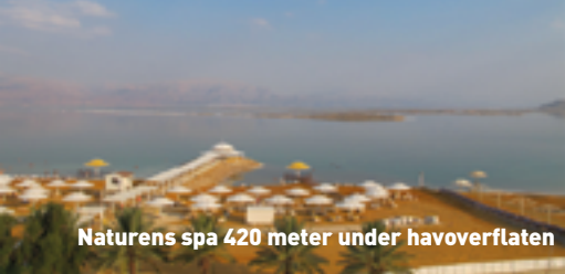
Naturens spa 420 meter under havoverflaten