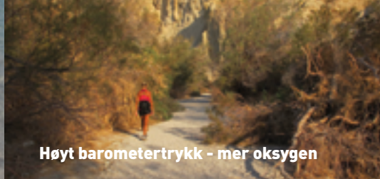
Høyt barometertrykk - mer oksygen