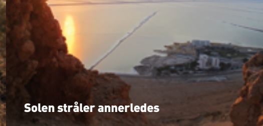
Solen stråler annerledes

verdens mest saltrike innsjø i en ørken på jordas laveste område, 420 meter under havoverflaten. Høyt barometertrykk gir økt tetthet av oksygen i luften. Minimal nedbør og høy temperatur hele året, gir tørr luft med lav relativ luftfuktighet. Kombinasjonen av de fire elementene sollys, luft, mineralsalter og svart mud, danner sammen et unikt «naturens helse spa» og et mikroklima som ikke finnes andre steder i verden. Denne ekstraordinære kombinasjonen av naturelementene har evnen til å reparere og fornye fysiologiske funksjoner og prosesser.