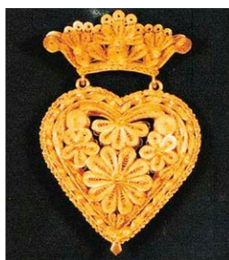
Vlnr: Curaçaoose resp. Surinaamse hanger tegen het boze oog; Surinaamse Kromanti-oorhanger voor iemand die een kromanti winti heeft; Kurazon di Korsow (hart van Curaçao), die soms door vrouw van een shon (rijke man) aan de Zwarte jaja (dienstvrouw) werd gegeven als dank voor vele jaren trouwe dienst. Deze werd van generatie op generatie doorgegeven.