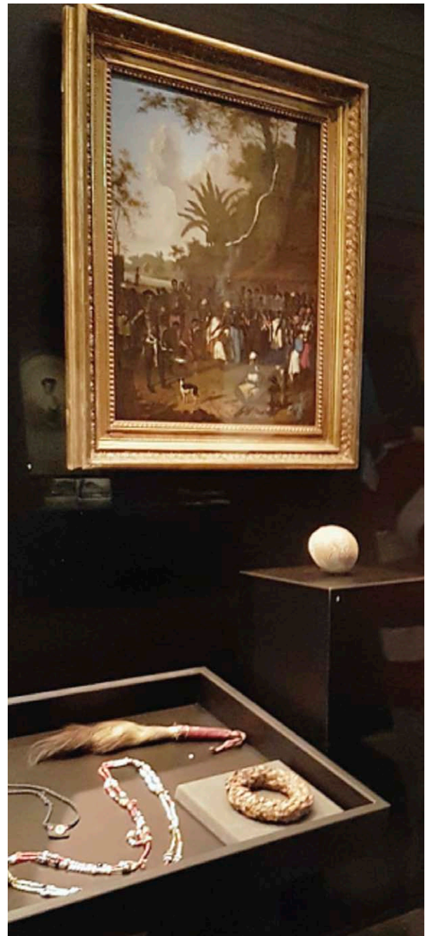
Vitrine met schilderij van Dirk Valkenburg 1707 in de Grote Suriname Tentoonstelling in de Nieuwe Kerk, Amsterdam 2019.

Naast de natuurlijke of organische stakeholders als Afro-gemeenschappen en onderwijsveld vormen 'overige Nederlanders', de overheid, de media, experts & makers en partnermusea de belangrijkste stakeholders in het NTASM. Zij moeten zich ook verbonden voelen met het museum en zijn daarom al in deze verkenning uitvoerig bevraagd. Daar waar dat enigszins meetbaar is (culturele veld, experts, onderwijs) lijkt het draagvlak en de nu al toegezegde betrokkenheid uitzonderlijk hoog. Over de diffuse rubrieken media en 'overige Nederlanders' is dat moeilijk te zeggen, maar spontaan straatonderzoek in Amsterdam leverde overwegend positieve reacties op.