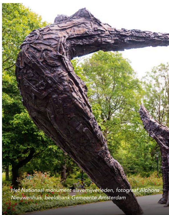
Het Nationaal monument slavernijverleden

Het NTASM werkt bovendien vanuit een vijftal kernwaarden. Deze hebben betrekking op de wijze waarop het museum zich verhoudt tot het Nederlands trans-Atlantisch slavernijverleden, de erfenissen en doorwerkingen daarvan en de Afrikaanse diaspora in meer algemene zin, evenals de wijze waarop het museum zich verhoudt tot haar externe en interne stakeholders. Deze kernwaarden zijn: Kracht, Waardigheid, Representatie, Dekolonisatie en Emancipatie.