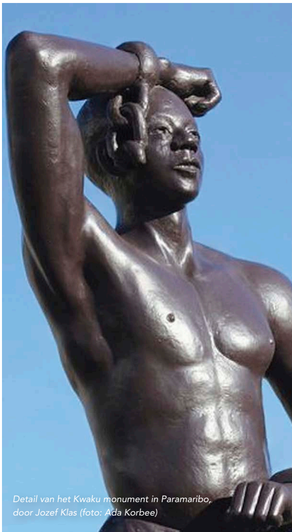
Detail van het Kwaku monument in Paramaribo, door Jozef Klas

Het NTASM is er voor iedereen omdat het over nationale en zelfs internationale geschiedenis gaat. Daar binnen zijn twee groepen van extra belang: Afro-Nederlanders, die de nazaten zijn van de door Nederland gedwongen diaspora uit Afrika en scholieren, studenten en docenten. Dit deel van de geschiedenis en de doorwerkingen ervan kan pas deel worden van ieders bagage in deze samenleving als er in het onderwijs structureel aandacht aan wordt besteed. Vandaar dat het museum zich ten doel heeft gesteld alle scholieren binnen één generatie in huis ontvangen te hebben en/of bij een van zijn activiteiten buitenshuis. De presentaties en programma's in en van het museum zullen gelaagd en divers worden aangeboden om een zo breed mogelijk en divers mogelijk publiek te kunnen bedienen.