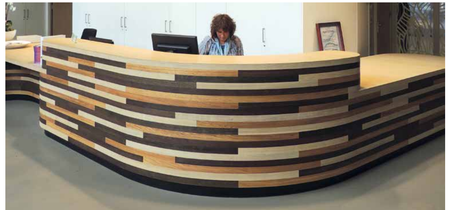
In opdracht van zorginstelling Archipel realiseerde de BVR Groep de nieuwbouw van kenniscentrum Landrijt.