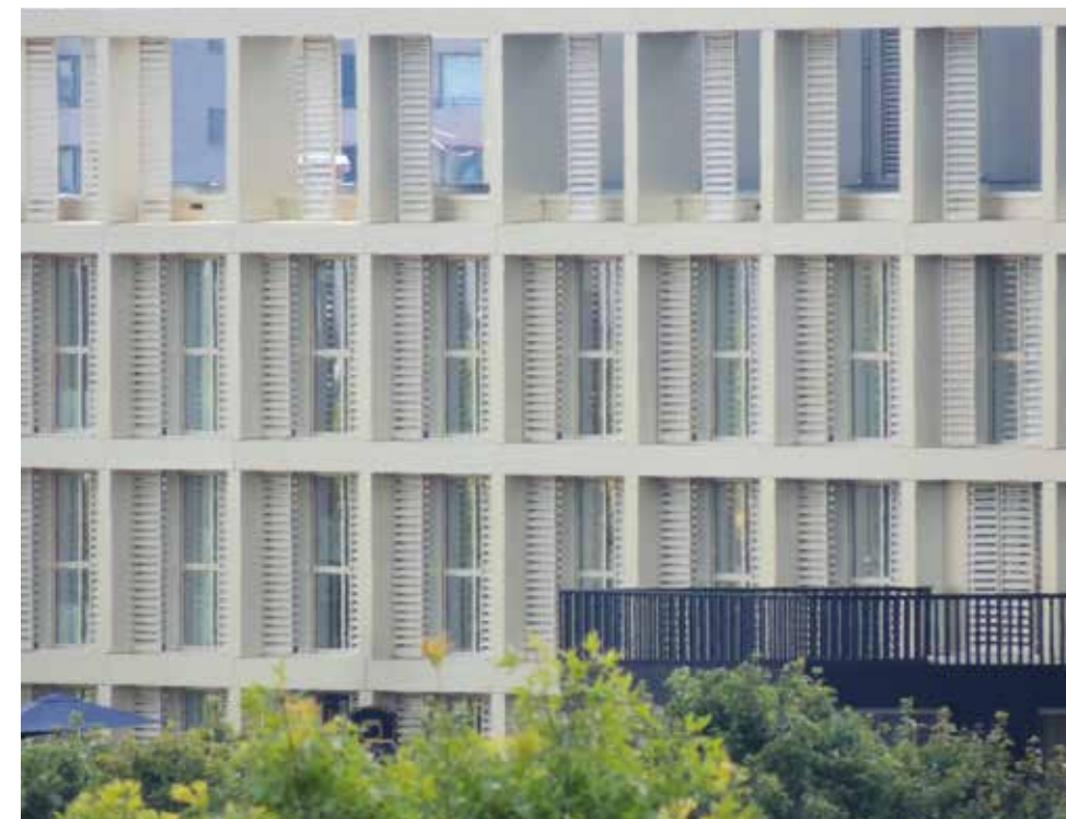
Het kenniscentrum-verpleeghuis Landrijt bestaat uit een drielaagse onderbouw en twee torens met drie en zeven bouwlagen.

Tijdens de bouw gingen zeven onderaannemers en twee hoofdaannemers failliet. Scherrenberg: “De BVR Groep faillieerde eveneens, maar kon na een doorstart verder gaan met het bouwproject. Door goede afstemming met diverse bouwpartijen en door over te werken werd de vertraging geminimaliseerd.” Hertogs besluit: “Na de feestelijke verhuizing van de cliënten vanaf een tijdelijke locatie volgt de feestelijke officiële opening. Het gebouw is al in gebruik. Uit reacties van zorgverleners, cliënten en buurtbewoners blijkt dat de accommodatie zeer bevalt.” ■