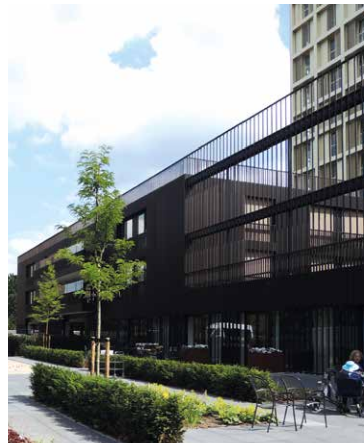
De onderbouw is bekleed met brons geanodiseerde koperprofielen.

T +31 (0)33 286 53 02 M +31 (0)6 53 641 797 E info@sfsf.nl W www.sfsf.nl