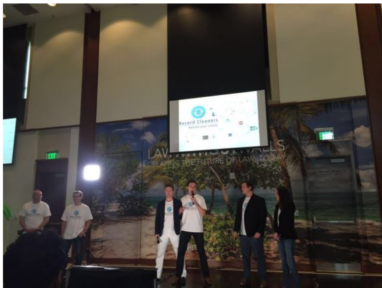
Komandos „Record Cleaners“ („Teistumo“ įrašų valytojai) projekto pristatymo akimirka / 2016 m., Majamio universitetas

Kitas projektas, sukėlęs daugybę minčių apie jo pažangumą, buvo susietas su informacinių technologijų kompanija IBM bei jos kuriamomis dirbtinio intelekto sistemomis. Šio projekto tikslas – pasinaudojant IBM vystomomis dirbtinio intelekto sistemomis sukurti taikomąją programą, kuri padėtų juristams atlikti rengiamų teisinių dokumentų kokybės analizę tam tikrais pjūviais ir pateiktų siūlymus dėl tobulinimo krypčių. Po šio projekto studentai buvo susisiekę su „IBM“ dirbtinio intelekto sistemų kūrėjais dėl tolimesnės projekto plėtotės.